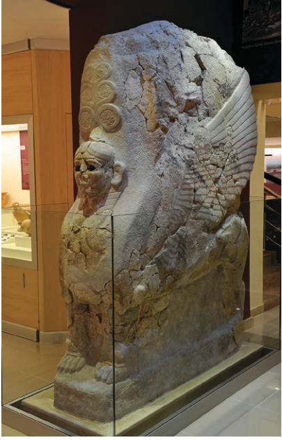
Boğazköy Sfenksi Hitit İmparatorluk Dönemi (M.Ö. 13. yüzyıl)

Boğazköy Müzesi, Çorum'un 82 km. güneybatısındaki Boğazkale ilçe merkezinde yer almaktadır. Çorum Müze Müdürlüğü'ne bağlı olarak hizmet veren müze, 12 Eylül 1966 yılında ziyarete açılmıştır. 2011 yılında yeniden düzenlenen müzede, Hitit başkenti Hattuşa kazılarında açığa çıkarılan eserler sergilenmektedir.