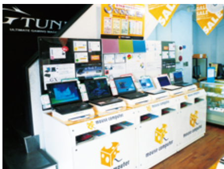
秋葉原ダイレクトショップ