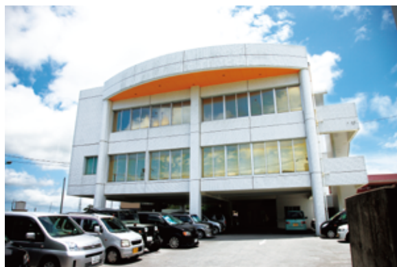
沖縄コールセンター

製品シリアル番号により、一台一台のパーツ構成情報が管理されています。コールセンターでは、詳細な仕様を把握することで、それぞれのパーツ単位にまで落とし込んだ対応が可能になっています。マザーボードの最大メモリはどの程度か、エラー情報にはどんなものがあるかなども確認しながら、より適切な対応を行うことができます。