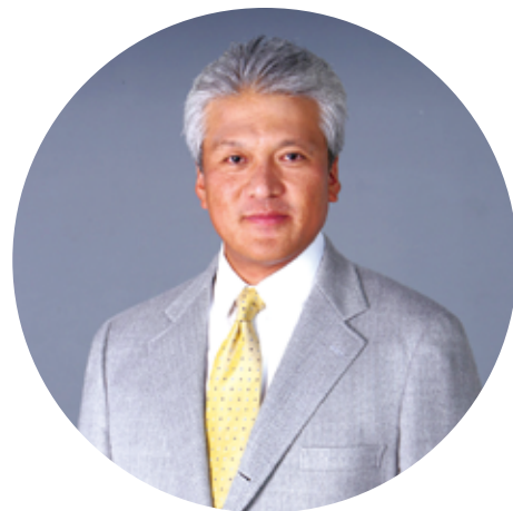
株式会社マウスコンピューター