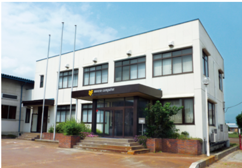
長野県・飯山工場