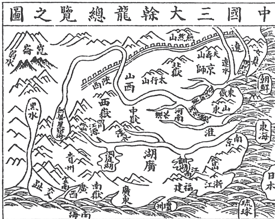
図3 中国三大龍と朝鮮・日本