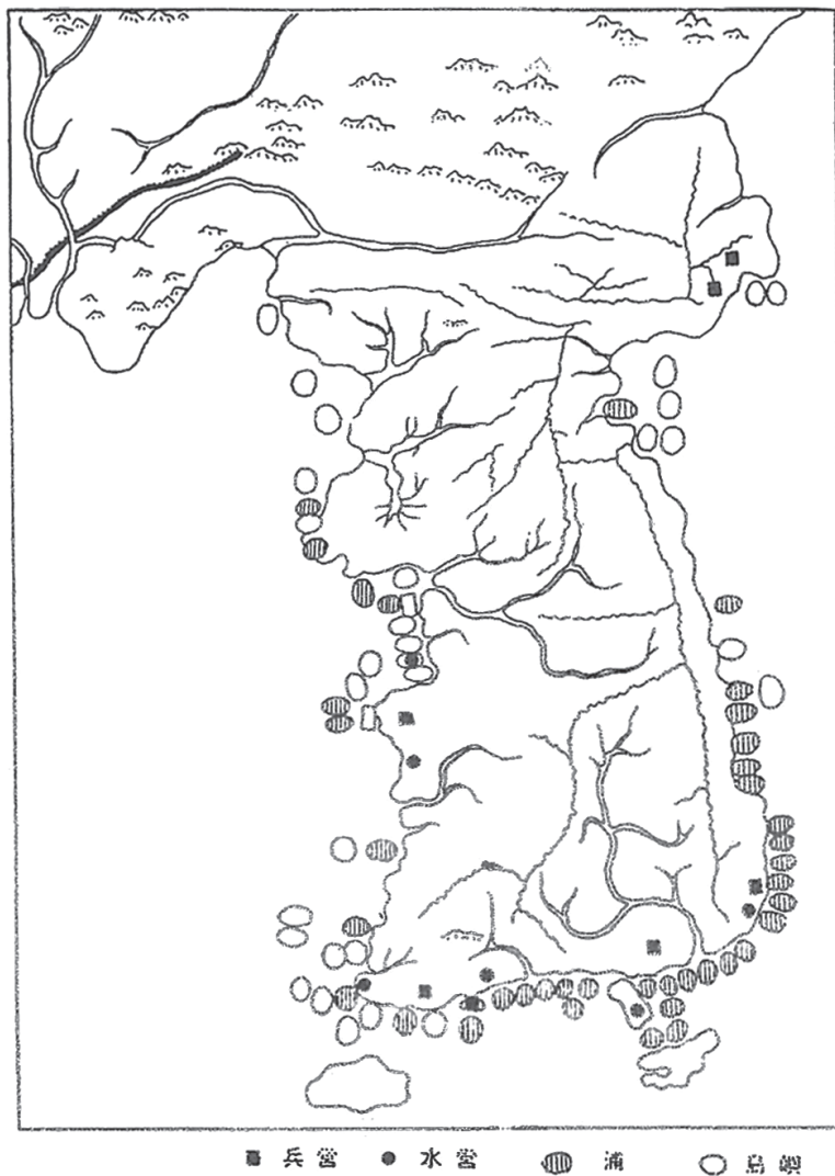
図1 「混一疆理」の朝鮮

(出所) 龍谷大学所蔵の原図、張保雄による作図、張保雄「李朝初期、15世紀において製作された地図に関する研究」地理科学、第16号、1972年。