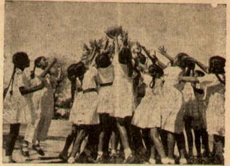
గ్రీడలలో గూడా శ్రమశిక్షణ పాఠశాల ప్రముఖుల వ్యవహారంలో ఒక భాగం విద్యార్థులను ఈ క్షణ

శ్రీ గుప్తు దీక్ష ముషయం ప్రభుత్వం వద్దకు చేరుకోలేదు. పైగా వారి దీక్షానమయంలోనే, నీరాను రద్దుచేయకపోగా, నీరా అంగళ్లను వేలం వేయించి ద్వారా పరోక్షంగా కల్లను ప్రవేశ పెట్టింది. మద్యనిషేధం ముషయంలో ప్రాయోగవేళం పులికం కాద - కొరవ 11 వ కేటో