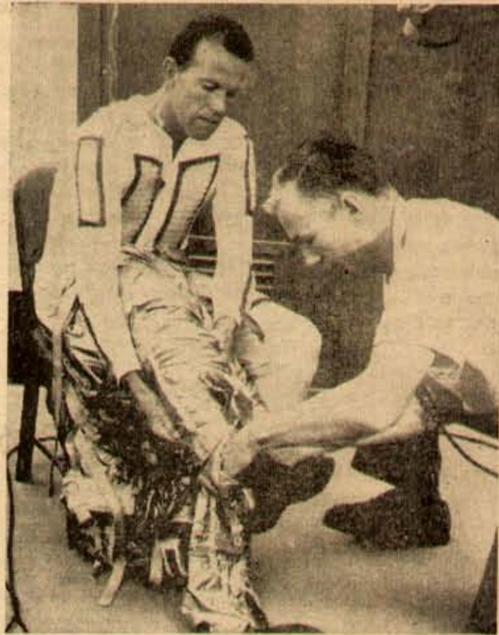
ఘోషికి 100 ముదలు 160 మైళ్ళ వరకు ఎక్కువ గంటకు 17500 మైళ్ళ వేగంతో 34 గంటలలో అంతరిక్షంలో ప్రసారాన్ని 22 పార్లు చుట్టి (మూడు 6 లక్షల మైళ్ళు) కేవలంగా క్రెడిటిట్ గిగిగి అమెరికా వ్యోమ గామి గార్డెట్ ఎల్ మాపర్ (వయస్సు 36 సం.), మాపర్ తన యాక్రమ ముందు వ్యోమయాన ప్రశ్నలకు దుస్తులను సెకర సహాయంతో సోదరుగు కోవడం పై చిత్రంలో చూడవచ్చు.

అన్నది యెల్ల రకు తెలిసిందే. అట్టే ఇటు మంత్రివర్గములనుబట్టివారిలో ముగ్ధుల చెన్నారెడ్డి, లక్ష్మీనరసయ్యలది ఒకవారి; మాజీమంత్రి జి. వి. సరసింగరావుగారిది వేరొకవారి. వీరెవ్వరికి అందరుండా, పొందరుండా సదుస్తులారు మంత్రి జి సదాలక్ష్మి. రవాణామంత్రి గురుమూర్తి