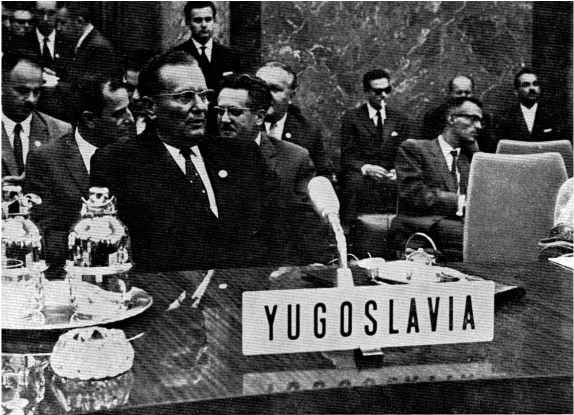
ЧЛАНОВИ ЈУГОСЛОВЕНСКЕ ДЕЛЕГАЦИЈЕ НА КОНФЕРЕНЦИЈИ.