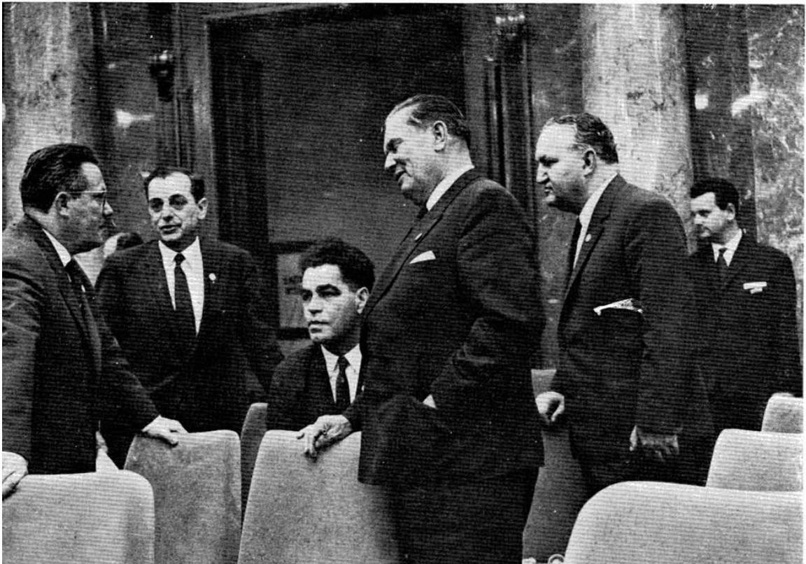
LES MEMBRES DE LA DELEGATION YOUGOSLAVE A LA CONFERENCE.