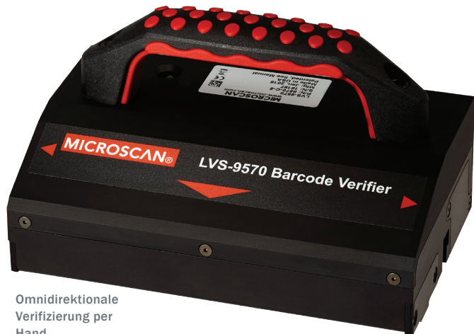
Omnidirektionale Verifizierung per Hand