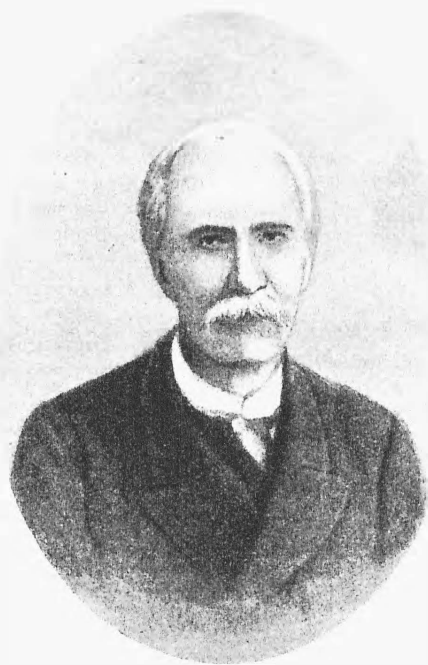
Мануэль Гарсія. (См. загр. мелочи).

медя «ужасно зажигательная вещь», какъ говорилъ полиціймейстеру полковникъ конюшеннаго вѣдомства... Репертуаръ калѣбится, режиссеръ, актеры, вслѣдствіе постоянныхъ измѣненій въ репертуарѣ, волнуются, публика ворчитъ, злосчастный антрепренеръ поджаривается на медленномъ огнѣ. То послалъ афишку для подписи слишкомъ рано, то очень поздно: «везите на квартиру». А на квартирѣ грозный окрикъ: «для дѣлъ есть канцелярія»... И терни все это, молчи лучше, не то совсѣмъ «задушатъ».