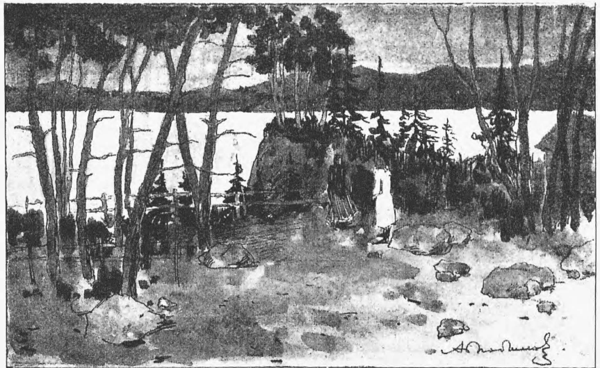
„Маленькій Эйольфъ“, Ибсена. Декорація 3-го дѣйствія.