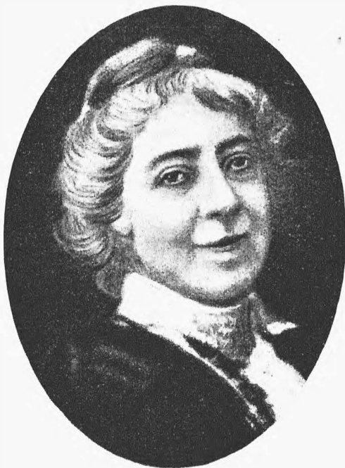
Полина Віардо Гарсія. (См. загр. мелочи).

тренно вздыхаютъ по французскимъ комедіямъ съ раздѣваніемъ на сценѣ до шелковыхъ inexpressibles и разныхъ dessous , тайкомъ морщатся, а все-таки ѣдутъ въ театръ. Антрепренеръ ходитъ сіяющій, артисты получаютъ исправно жалованье и благословляютъ «чудный городъ», умѣющій такъ цѣнить и любить драматическое искусство. Но попадутъ въ этотъ городъ черезъ три, четыре года, и—тѣ же улицы, дома, но порядки другіе, и жизнь совсѣмъ уже не та... Полиція придирается, мучаетъ разными строгостями. Директора театра, статскіе совѣтники, во всю жизнь не прочитавшіе ни одной пьесы, по попавшіе въ директора ради удовольствія дремать вечеромъ въ даровомъ креслѣ, отставные полковники, бывшіе лихіе кавалеристы, изводятъ своими капризами, несуразными требованіями. А самое главное, дорогія мѣста пустуютъ, ибо такъ называемая, губернская аристократія блещетъ отсутствіемъ. Ис-