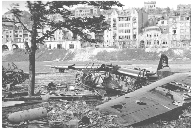
A Vérmező, amelyet a roncok és a romok teljesen feltöltöttek

Tavasszal elkezdődött a hivatalos romeltakarítás. Keskeny vágányú síneket fektettek le a vári utcákon végig egészen a Vérmezőig, ami akkor egy kopár, mély teknő volt, katonai kiképzésre és sportlovaglásra alkalmas terep. Csilléken szállították a törmeléket. Mi, gyerekek gyakran fölkapaszkodtunk a csillékre, és élvezettel „utaztunk” le a Széll Kálmán térig.