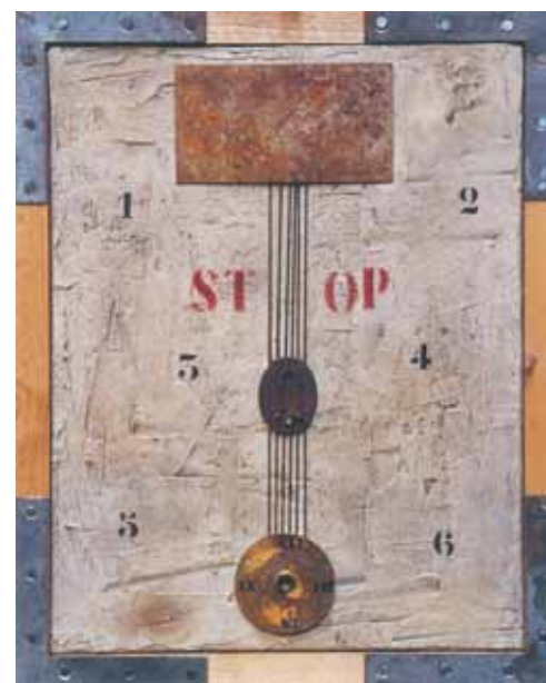
Le Temps Время Time 2002 162x130 cm

Ash uses strips of barbed wire to indicate the horror of the inevitable, and to associate it with the thorns that crowned the head of Christ (the central part of the work "Tous Ensemble"). The installation "Des Roses pour les Justes" (Roses for the Just) is an ever blood-red tomb, with roses that are growing – contrary to what is possible – from the ashes. Thus he constantly plays on the meaning of his own surname: "ash=ashes=dust". He creates a series of works with the title "Poussiere d'E-