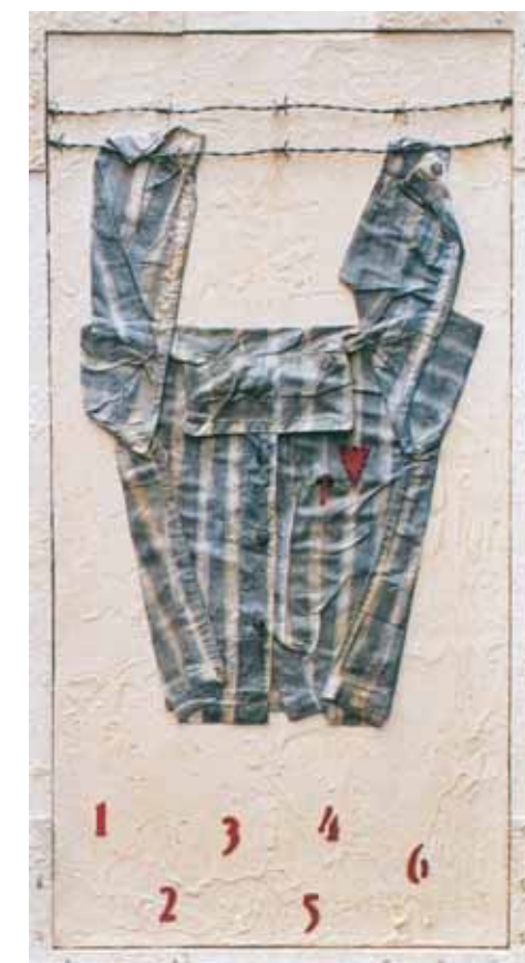
Hiver '42 Зима, 1942 Winter '42 2002 162x130 cm