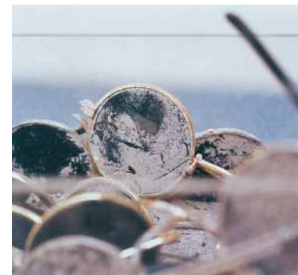
Poussiere d'etoile Прах звезды Dust of the star 2002 50x50x50 cm