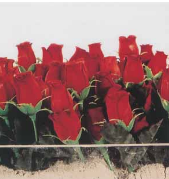
Des roses pour les justes Розы для праведников Roses for the Just 2002 50x50x50 cm

Времени, в котором Художник и зритель сосуществуют на равных. Искусство способно передать нечто нематериальное, безгласное, немое, что, как «угль, пылающий огнем», горит в сердце художника и взывает жечь, обжигать сердца людей. Творчество Марка Аша напоминает нам о тех, кто когда-то был чьим-то ребенком, матерью, отцом, братом, сестрой, мужем, женой... кто превратился в пепел в огне крематориев... кто не смог спастись... чьи крики и стоны до сих пор эхом отзываются в сердцах живущих ныне на земле и будут, непременно должны быть услышаны всеми, кто придет на эту землю, чтобы жить.