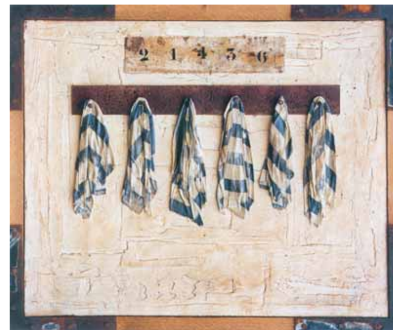
Vestiaire Раздевалка Locker Room 2002 130x162 cm

Мощный, усиленный внутренним эмоциональным напряжением посыл Марка Аша невольно заставляет вспомнить Гойю, Гроса, Грундиг, Дикса, Неизвестного, Пикассо, Сидура, Цадкина и наряду с ними всех тех, кто открыто говорил об ужасах войны. Марк Аш отверз свою душу для обще-