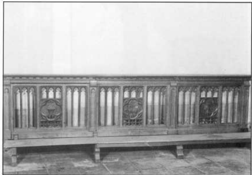
Foto 5: Communiebank ca. 1900, neogotisch, eik. Deel rechts met Mannaregen, het Lam Gods met wimpel en de hostiedragende kelk