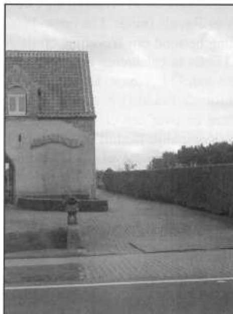
Steenweg op Weelde 117 te Poppel: rechts achter deze boerderij viel de V2