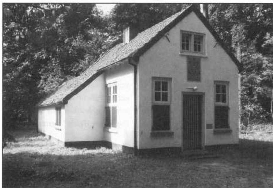
Op de plaats van dit witte jachthuisje stond de grote Tulderhoeve uit 1662

Enkele jaren eerder werd de grens tussen de vroege van genoemde dorpen gebaseerd op een akkoord de dato 8 oktober 1633 nog eens nauwkeurig nagelopen. In 1765, toen wisselde de hoeve voor het eerst van eigenaar, startten de belanghebbenden vanuit Rovert: ten eynde eendragtelyck te begaan den reen, en lemietscheijdinge van den aart tussen Hilvarenbeek, Poppel en Welde, sijnde gedaan ende bevonden soo ende gelijk hier naar is volgende. Eerstelijck schijdende en beginnende van de sluijse van den Roverse watermoolen linie regt tot op den hoek van de wal der hoeve van Thulder naar Welde uijtgeleg en van daar voort continueerende deselve regt lenia regtuyt tot den Beekse aart ende heyde naar Mierd waarts aan, op seekere pael off paalput, te weeten een en twintig roeijen en twaalf voeten van den selven gragt van de Tulderse hoeve, strekkende naer Mierde toe aan. (...) Ten eynde daardoor alle occasiën van verschillen des aangaande (:de welke andersints in tijden en weijden daar over soude hebben kunnen op koomen:) voor te komen (...)