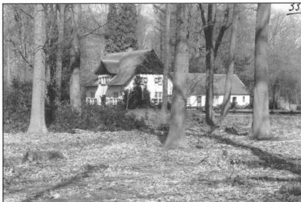
Op deze plaats stonden de stallen en schuren van de oude Tulderhoeve