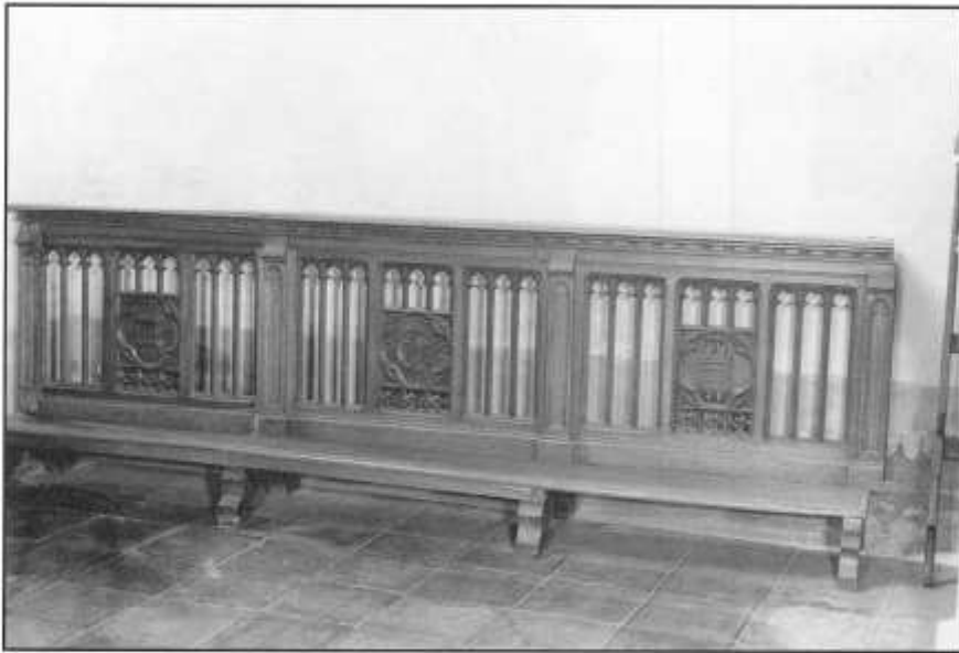
Foto 4: Communiebank ca 1900, neogotisch, eik. Deel links met voorstellingen van de Ark van het Verbond, een Jezusmonogram en de Toonbroden