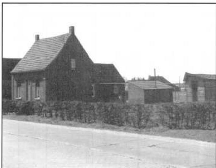
Het huisje in de Singelstraat