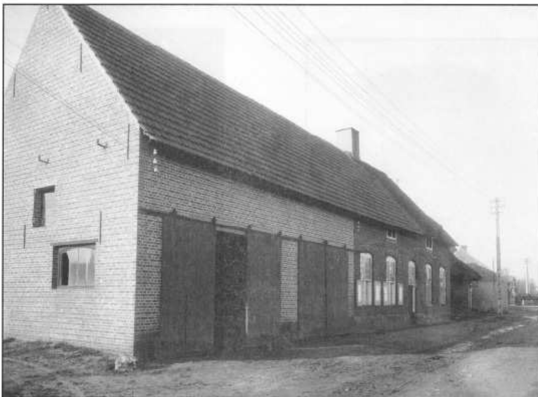
De Postele Hoeve vlak voor de afbraak, het linkerdeel van de hoeve is reeds afgebroken en vervangen door een magazijn

Ten thienden zullen de pachters of iemand van hun huysgezin geen vettigheid, mest oft asschen geduerende hunnen termijn op de hoeve gemaect,