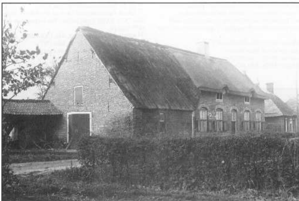
De Postelse Hoeve in de Krommendijk anno 1897

en 75 roeden bouwland en drie bunders en 15 roeden weiland.