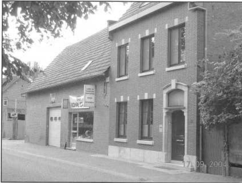
Firma Herman Cooremans-Van Beurden (17 september 2004)

op andere, als op abdije gronden mogen voeren, weggeven of verkopen op pene van huerbreuk, maer zullen gehouden zijn het land, grocs of weyde daer mede behoorlijk te mesten.