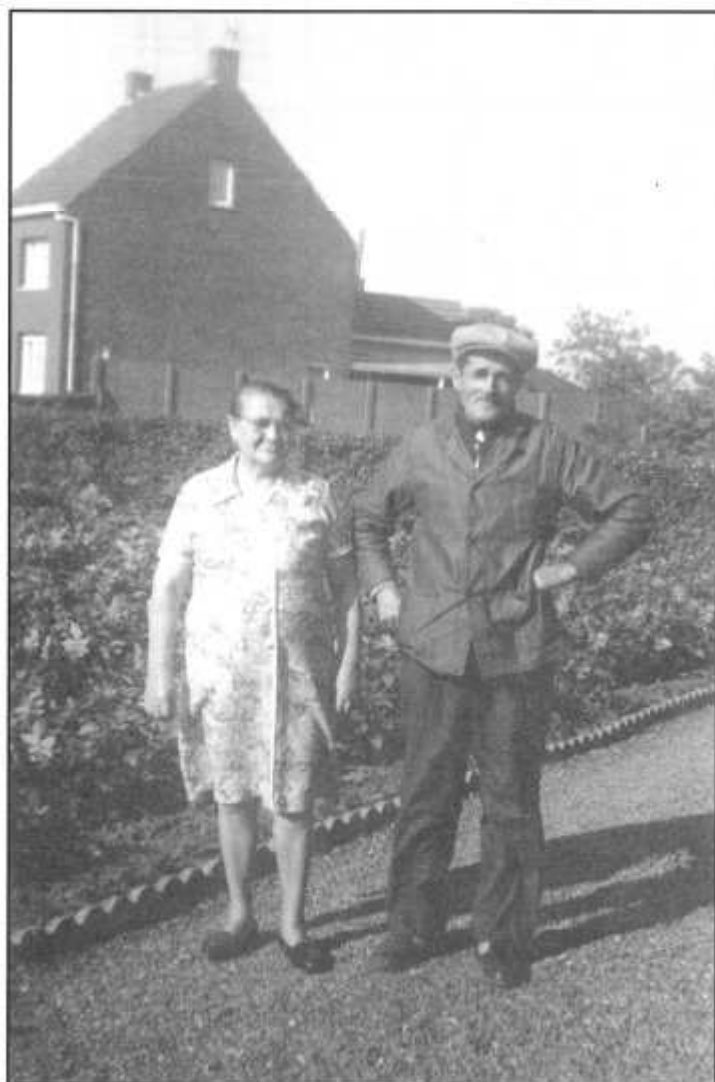
Grootvader en grootmoeder voor de moestuin (1976)