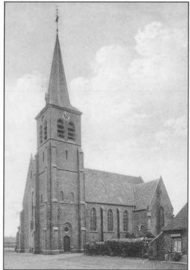
De St.-Adrianuskerk te Ravels-Eel