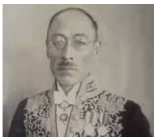
▲臺南高等工業學校首任校長若槻道隆。