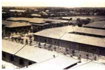
▲臺南高等工業學校電氣工學科校舍。

安，於是以臺南為中心展開商專升格高商之請願運動。當時總督府曾提議設立高工以替代廢校後的商專，惟因財政因素與生源堪慮，未見實現。嗣後經內田嘉吉總督更迭，後任伊澤多喜男總督