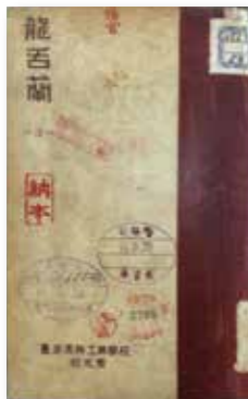
▲臺南高等工業學校。