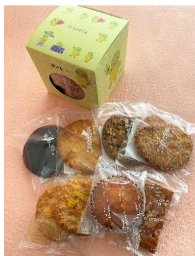
● 御菓子舗 三原堂本店 【和菓子】 カメレちゃん お菓子詰合せ 937円(税込)限定50個