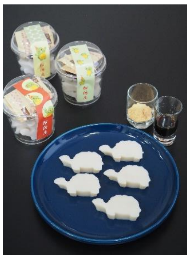
● 船橋屋 【和菓子】 亀カップくず餅(カメレちゃんver.) 500円(税込)