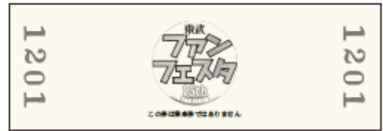
△記念乗車証（D型硬券）