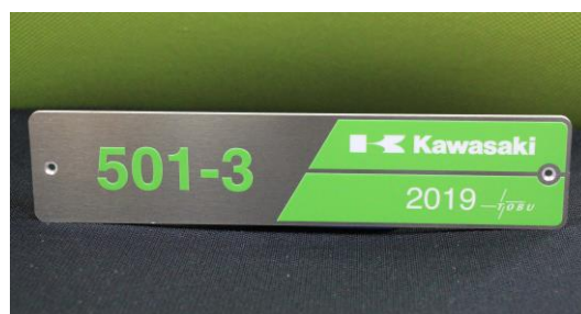
△リバティプレート (イメージ)