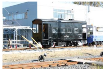
△車掌車[ヨ 5000 形]の体験乗車

<問い合わせ> 株式会社セレスポ 東武ファンフェスタ2019事前応募係 電話 03-5974-5508（10:00～17:00 ※平日のみ）