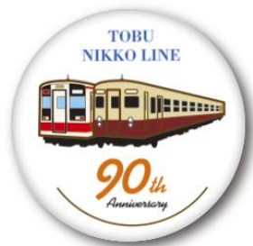
△大型缶バッジ・ピンバッジ（イメージ）