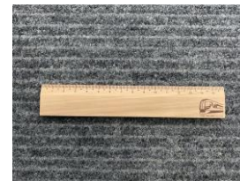
△東武鉄道オリジナルスケール（イメージ）

東武鉄道が保有している森林の環境保全活動や、東武グループが実施している環境に優しい活動等に関わるクイズを出題します。 正解の方に、環境整備している森林から出た木材で作製したオリジナルノベルティをプレゼントします。 クイズのヒントは会場内にあります。 ※小学生以下対象・先着800名限定