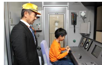
△運転シミュレータ