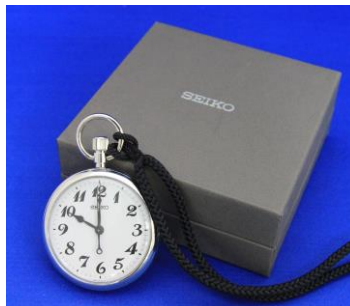
△ 鉄道時計 「東武日光線全通 90 周年記念」仕様 限定 10 個・35,000 円（税込み） シリアルナンバー入り