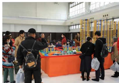
△ 昨年の東武ファンフェスタの様子