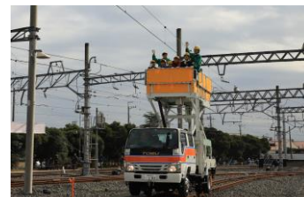
△軌陸両用型架線作業車