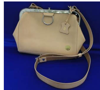
△ 東武鉄道車掌用カバン 〔レプリカ〕 「栃木レザー革製」仕様 限定 10 個・16,000 円（税込み） シリアルナンバー入り

※上記商品については、会場にてお一人様 1 つの商品につき 1 枚の整理券を配布します。 ※ジャンク品の販売は行いません。