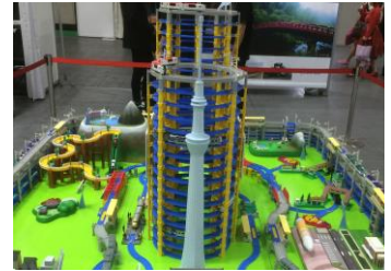
△SL 大樹, 東武リバティ, 東武 50050 型クレヨンしんちゃんラッピングトレイン ほかプラレール即売会(東武百貨店販売ブース)