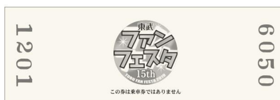
△記念乗車証（D型硬券）