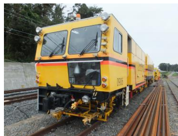
△マルチプルタイタンパー(イメージ)

鉄道の安全運行を支えるマルチプルタイタンパー、電気検測車、架線作業車(軌陸両用車両)、東武グループのバスなどを展示します。