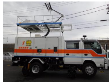
△電気検測車(イメージ)