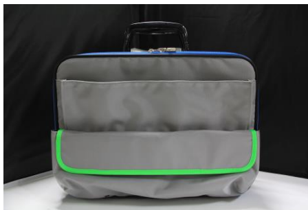
△ 東武鉄道運転士用カバン 〔レプリカ〕 「60000系デザイン」仕様 限定 20 個・20,000 円（税込み） シリアルナンバー入り

東武鉄道運転士用カバン〔レプリカ〕「60000系デザイン」仕様を限定販売するほか、東武ファンフェスタの開催を記念した会場限定の各種鉄道グッズ及び鉄道各社の各種関連グッズなどを販売します。