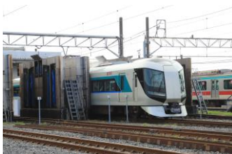
△車両洗淨線を走る電車 体験乗車