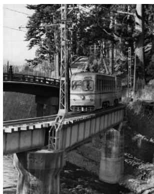
△ 「東武沿線」の写真（イメージ）