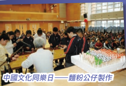
中國文化同樂日——麵粉公仔製作