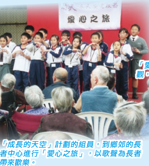
「成長的天空」計劃的組員，到鄉郊的長者中心進行「愛心之旅」，以歌聲為長者帶來歡樂。