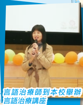
言語治療師到本校舉辦言語治療講座