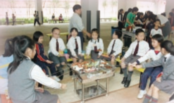
全方位獎勵計劃學生除可換領最心儀的禮物外，成績最佳的四十位同學可獲邀參加燒烤大會。