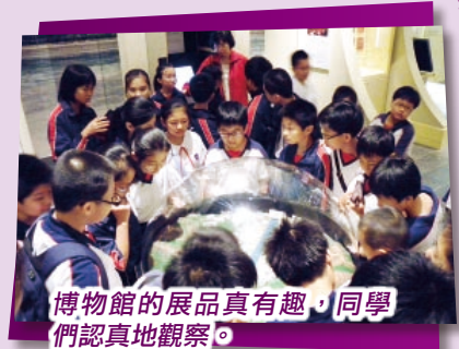
博物館的展品真有趣，同學們認真地觀察。