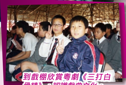
到戲棚欣賞粵劇《三打白骨精》，認識戲曲文化。