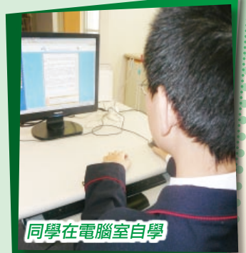
同學在電腦室自學