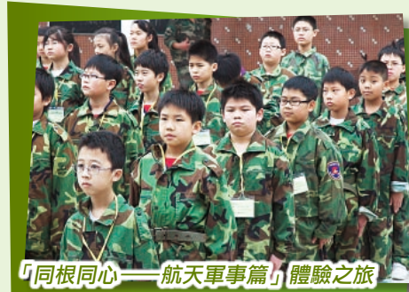
「同根同心——航天軍事篇」體驗之旅