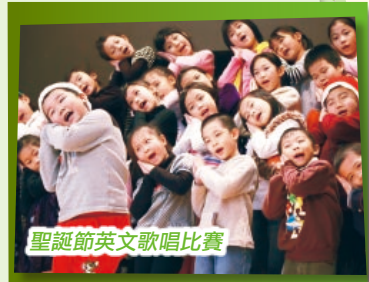
聖誕節英文歌唱比賽