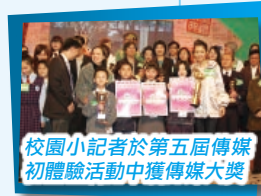
校園小記者於第五屆傳媒初體驗活動中獲傳媒大獎