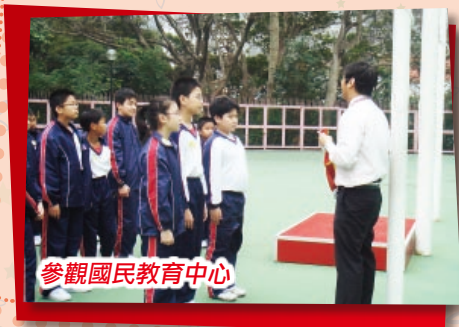
參觀國民教育中心