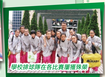
學校排球隊在各比賽屢獲殊榮