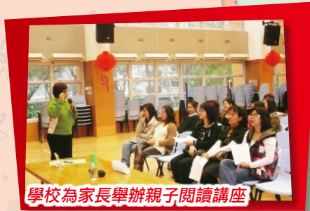
學校為家長舉辦親子閱讀講座