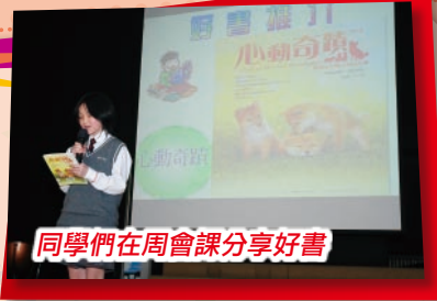
同學們在周會課分享好書