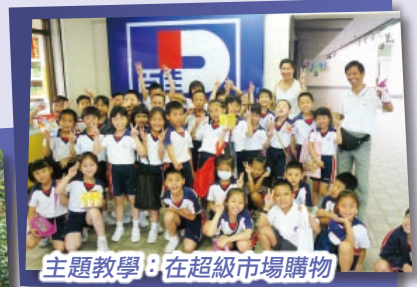
主題教學：在超級市場購物