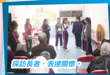
探訪長者，表達關懷。