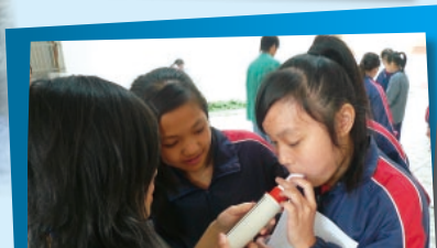
在「心·想飛」毒物拒試計劃中，小六全體學生進行了「身體健康大測試」，包括肺活量之量度。