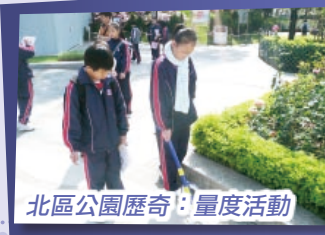
北區公園歷奇：量度活動