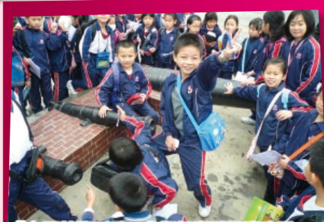
「主題教學活動」參觀粉嶺圍及消防局