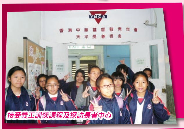
接受義工訓練課程及探訪長者中心