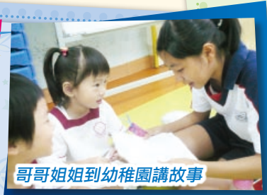
哥哥姐姐到幼稚園講故事