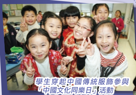
學生穿起中國傳統服飾參與「中國文化同樂日」活動