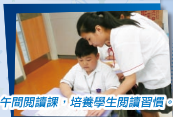
午間閱讀課，培養學生閱讀習慣。