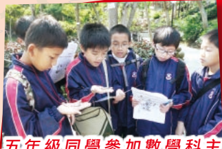
五年級同學參加數學科主題學習——北區公園歷奇，把課堂所學的知識應用於實際生活中。