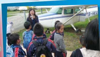
「愛心小天使」與家長一同到飛行總會參觀，增廣見聞之餘，親子關係亦拉近了。