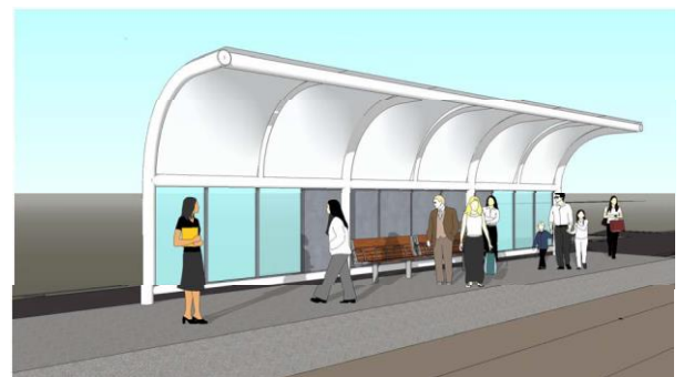
石津北停留場イメージ図