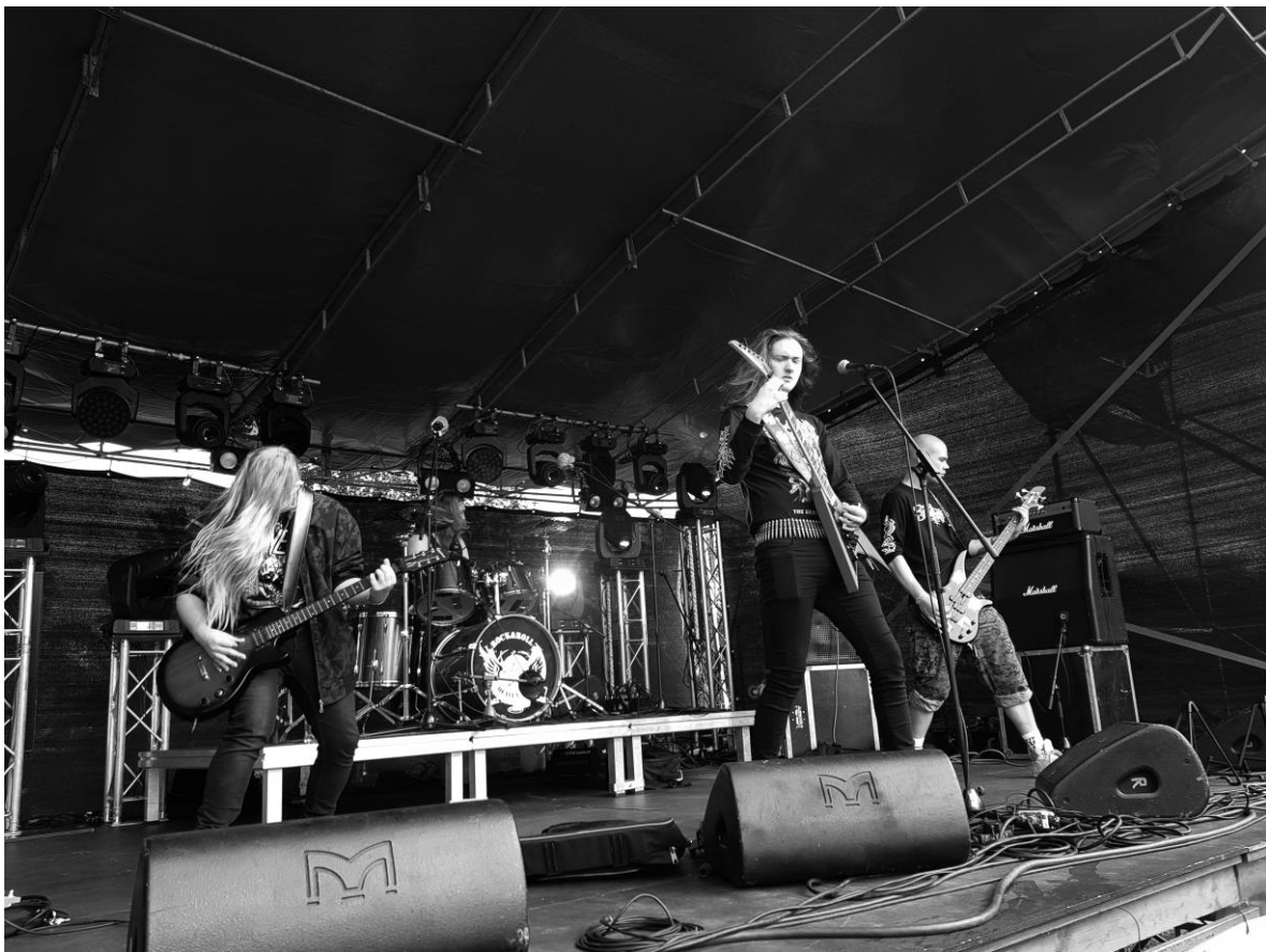
* Koffin esinemislõomas Punk & Rock festivalil 2020