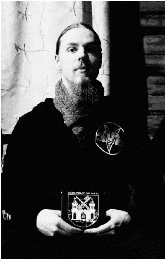
* Kruxator plaadiga „Tarbathian Fortress”