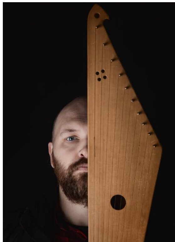
* Mees ja kannel – ajatu kombinatsioon

Album on planeeritud anda välja 2020. aasta detsembris või 2021. aasta jaanuaris (hetkel on käsil miksimine), nime tal praegu veel pole. Esmalt laen ta üles kõige populaarsematele platformidele – Bandcampi, iTunes'i, Spotify'sse jne. Hiljem võib-olla avaldan selle ka CD peal.