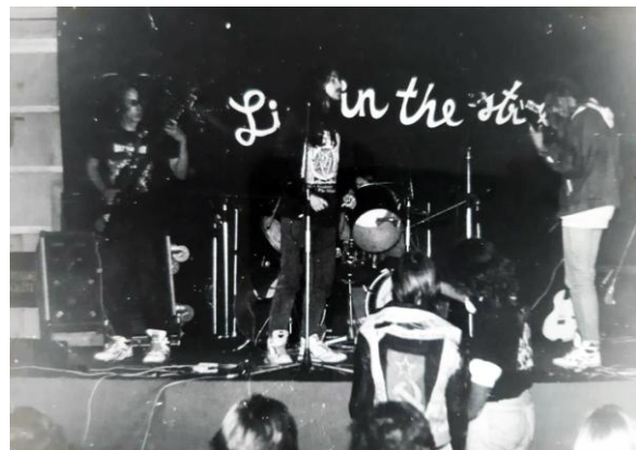
* Suicide esinemas „Live in the street”

või andis kasutada oma tehnikat. Need vennad ehitasid ka ise plokke ja pille. Kui bänd oli juba loodud, siis vajasime ka prooviruumi. Neid meil ikka oli – alguses ühes keldris, siis Tõrvandi spordisaali jõusaalis ning edasi maandusime juba vägevas ohvitseride majas (Tartus aadressil Puiestee 73a). Saavutustest väga uhkelt rääkida ei saa, aga salvestasime siiski ühe loo ja andsime vist kokku kolm-neli kontserti. Kontserdid olid menukad, näiteks „Live in the street”, „Metal ülevaatus”... Esinesime koos Nekropoli, Westsoniga... Ega väga ei mäletagi. Hea oleks mõni vana kontsertplagu üles leida.