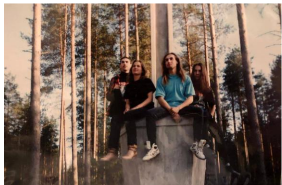
* Suicide'i fotosessioon Tuigo kalmistul

MAFIK: Metal- ja rock- musa on mind terve senise elu saatnud ja juhatanud ning kui peaksin Peetruse ees seisma, siis on mul kindlasti mõned head plaadid kaasas. Ja nagu vanad pleknabad ütlevad, siis „raisk, see oli hea!”