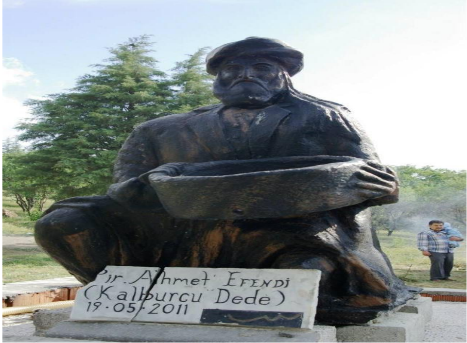
Pir Ahmet Efendi