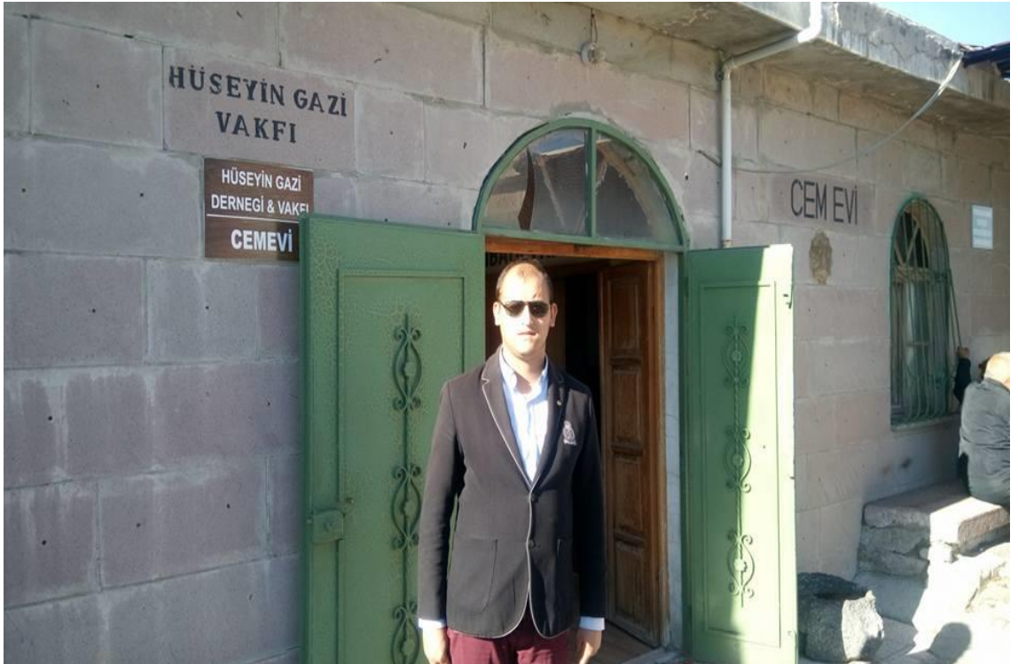
Ankara Hüseyin Gazi Derneği ve Cem Evi