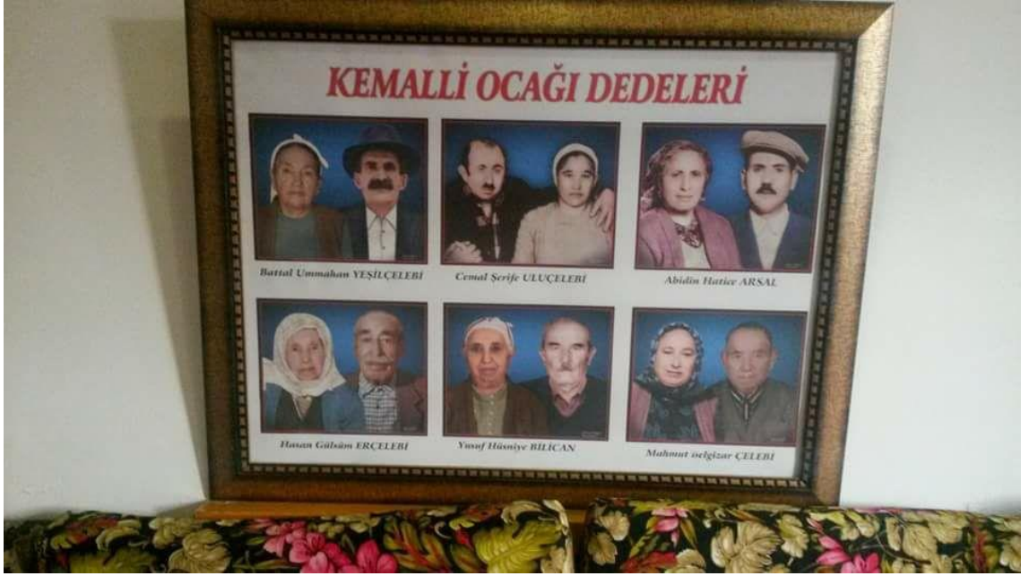
Kemallı Ocağına bağlı dedeler