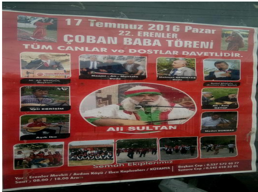
Çoban Baba Anması