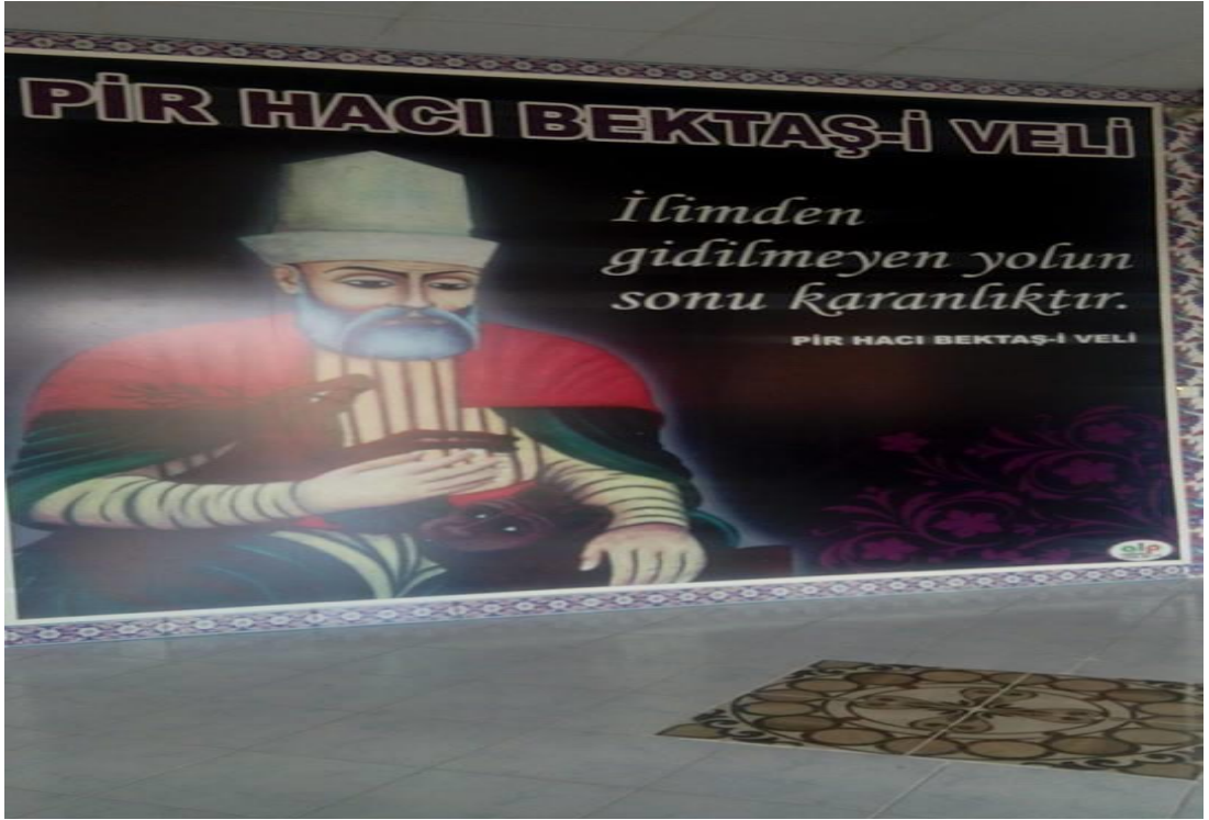
Kütahya Hacı Bektaş-ı Veli Kültür ve Sosyal Yardımlaşma Derneği- Cemevi