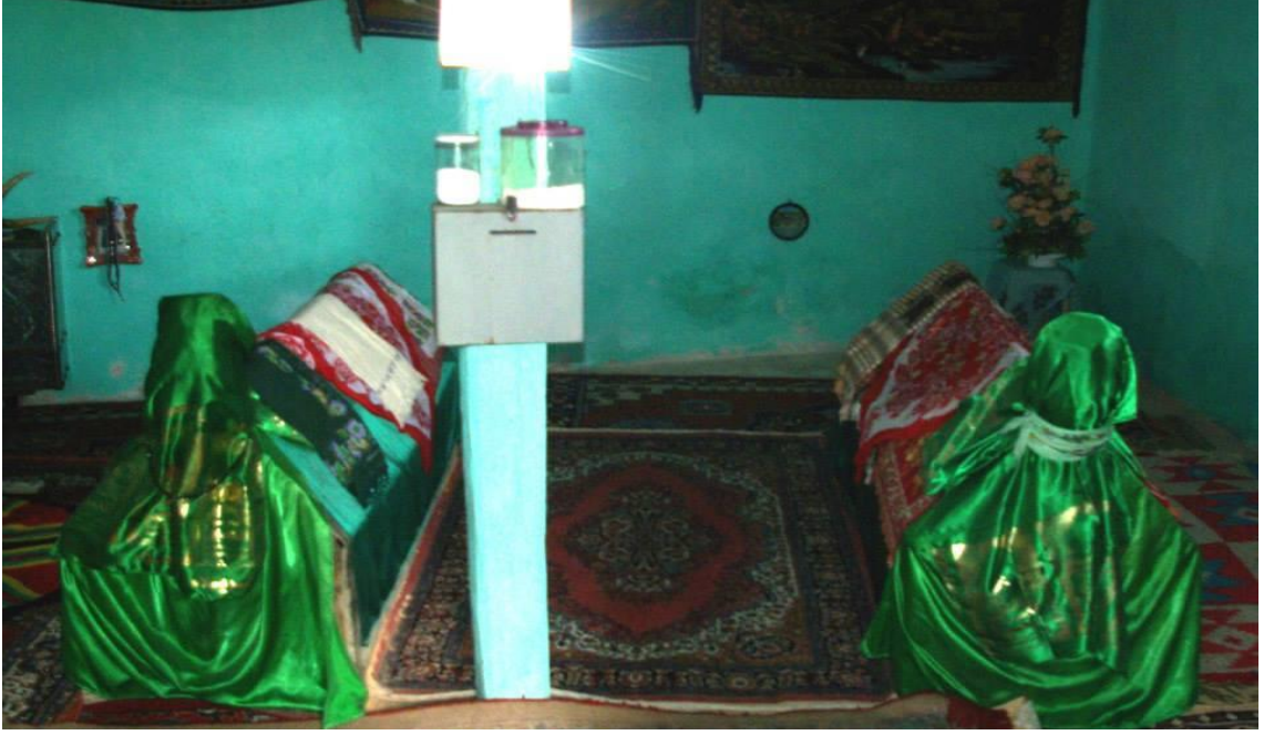
Demirli Baba ve Gayb Erenler