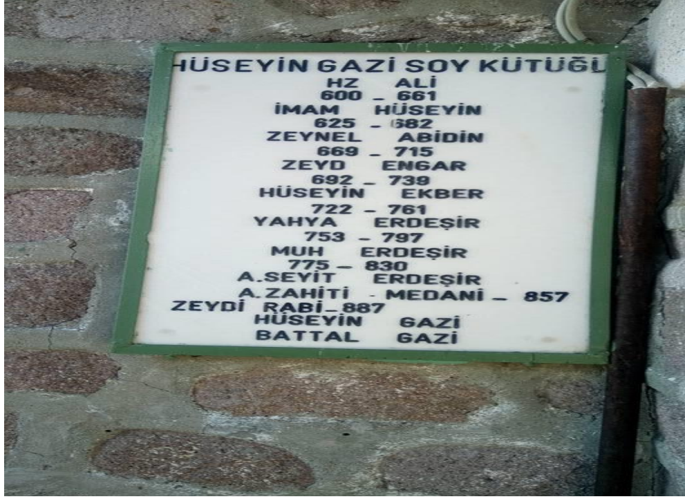
Hüseyin Gazi Soy Kütüğü