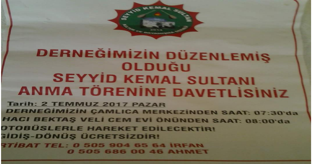
Seyyit Kemal/Cemal Sultan anma ilanı