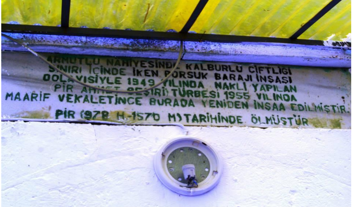
Pir Ahmet Efendi