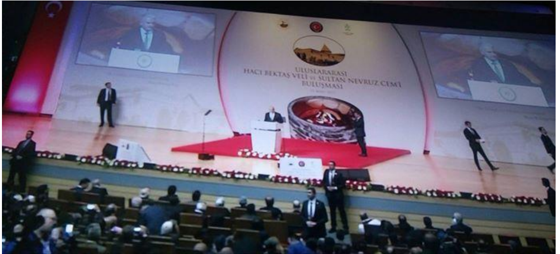
2017 Yılı Hacı Bektaş Veli Sultan Nevruz Cemi