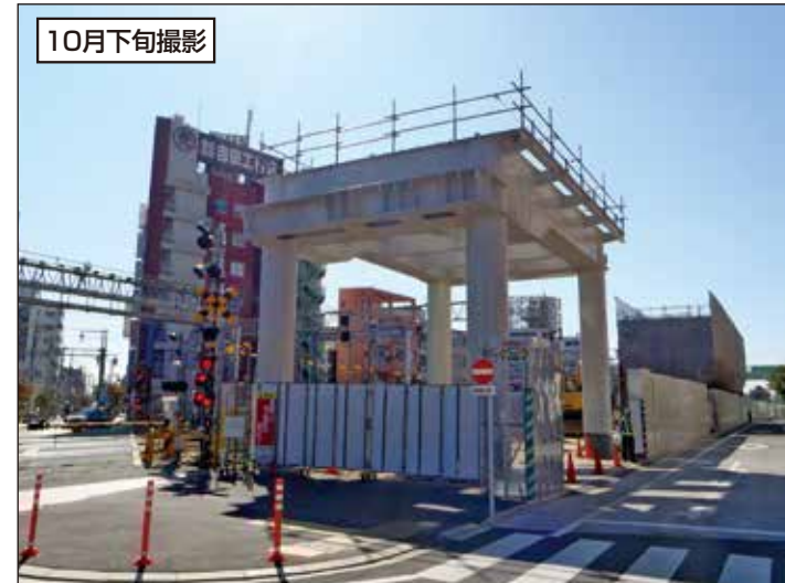
② 赤山街道路踏切付近における下り急行線高架橋の施工状況です。