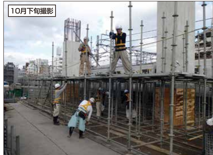
① 伊興町第二アパート付近における下り急行線高架橋の施工状況です。