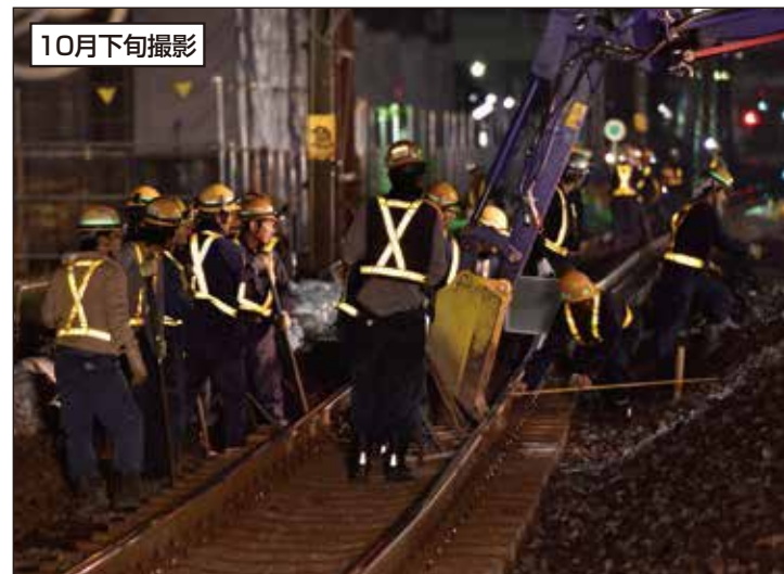
④ 下り急行線を東側に移設しました。今後、移設によって空いたスペースに高架橋を建設していきます。