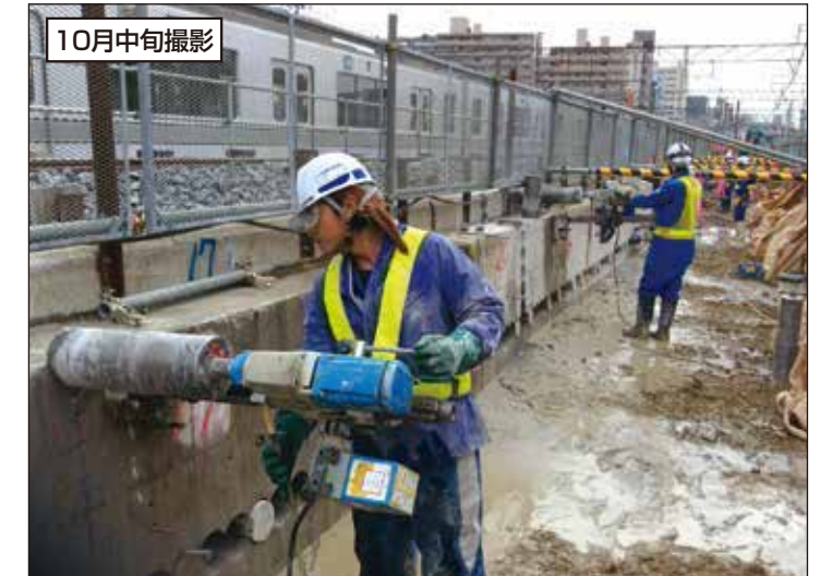
③ 下り急行線を移設するための準備工事を行っています。写真は支障物を解体している状況です。