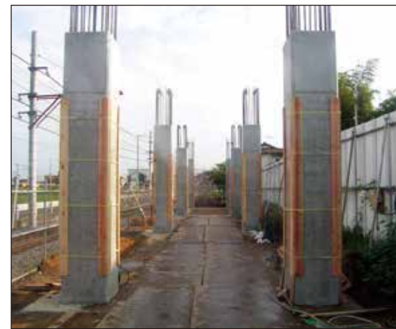
② 清水公園駅寄りの線路西側では高架橋を建設しています。