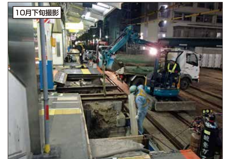
⑥ 駅部では終電後にホームの一部を取り外し仮地下通路を作るための準備工事を行っています。

※工事期間中は、ご利用のお客様にはご迷惑をおかけしますが、ご理解、ご協力をお願いいたします。