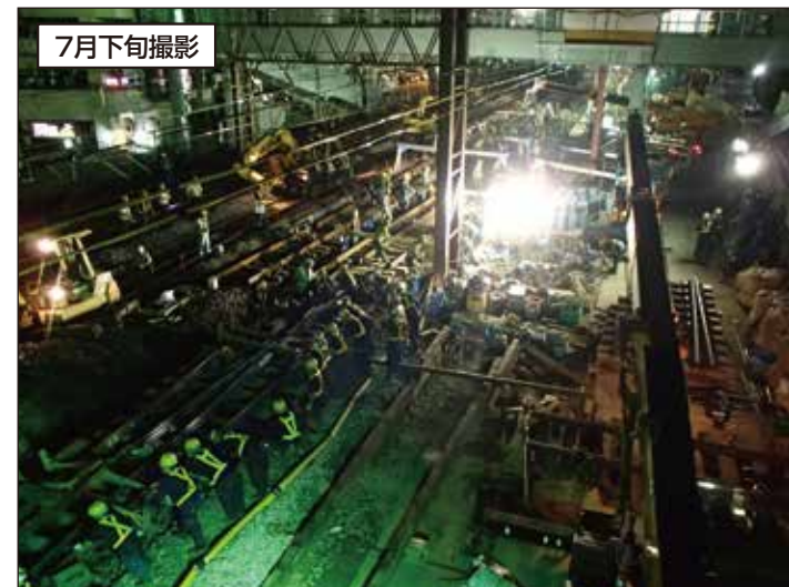
⑤ 線路の移設に伴い、作業員210人体制でダイヤモンドクロッシングと呼ぶポイントを設置しました。