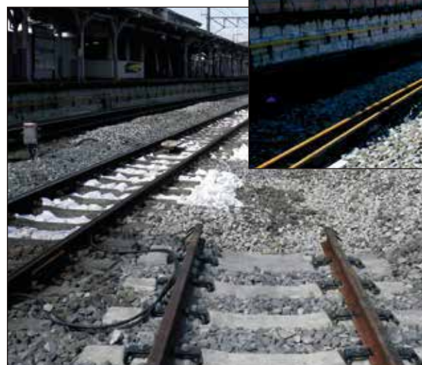
③ 9月28日より、1番線ホームの使用を中止し、春日部・大宮方面行ホームを2番線、柏・船橋方面行ホームを3番線に変更しました。