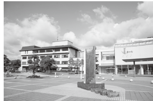
高岡市役所 (福岡庁舎)