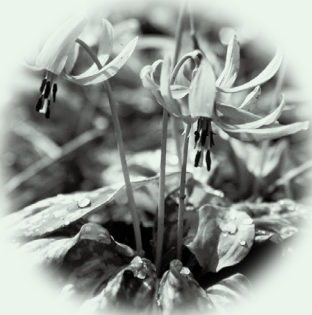
● かたかご ● (カタクリ)