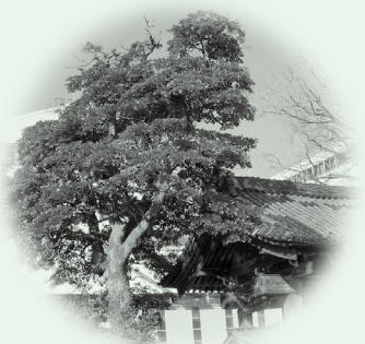
● つまま ● (タブノキ)

市民または市にゆかりの深い人で、広く文化、社会の進展、公共の福祉の増進に貢献され、郷土の誇りとして市民から深く敬愛されている人に「高岡市名誉市民」の称号を贈っています。