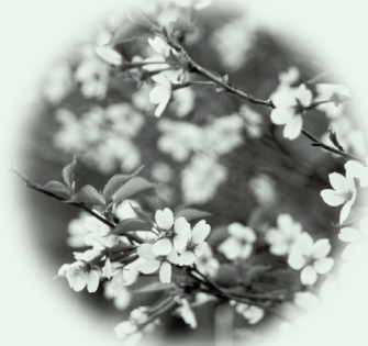
● さくら ● (サクラ属)