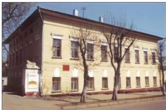
Дом № 33 по ул. Московской

«...Его Сиятельство изволил осматривать гимназии – мужскую и женскую, духовную семинарию, уездное училище, «Ремесленный детский приют» и земское училище» [30]. Было отмечено, что уездное училище до сих пор не преоб-