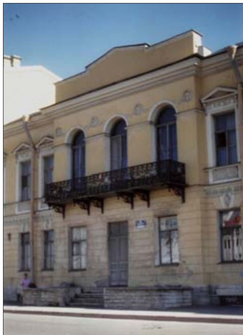
Дом № 50. Английская набережная. г. Санкт-Петербург