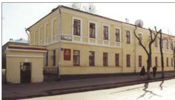
Дом № 30 по ул. Московской

Дома по ул. Московской №№ 30 21 и 32 (ныне это здание административно-го назначения и Волго-Вятский институт (филиал) Московский государственный юридический университет