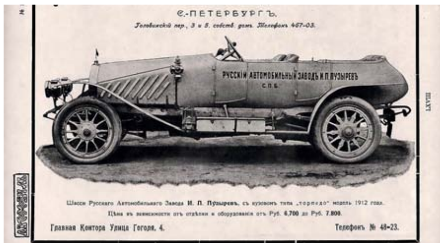
Автомобиль завода И. П. Пузырёва.