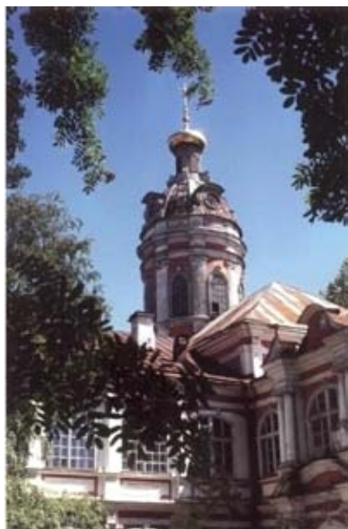
Фёдоровская церковь. г. Санкт-Петербург