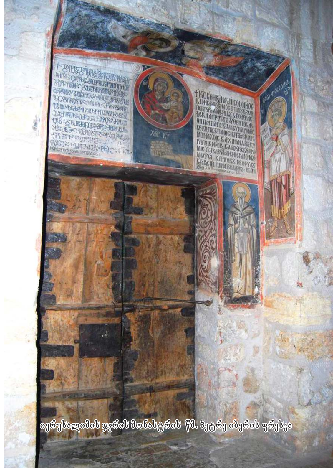
იერუსალიმის ჯვრის მონასტრის წმ. ნეტარ იბერის ფრესკა