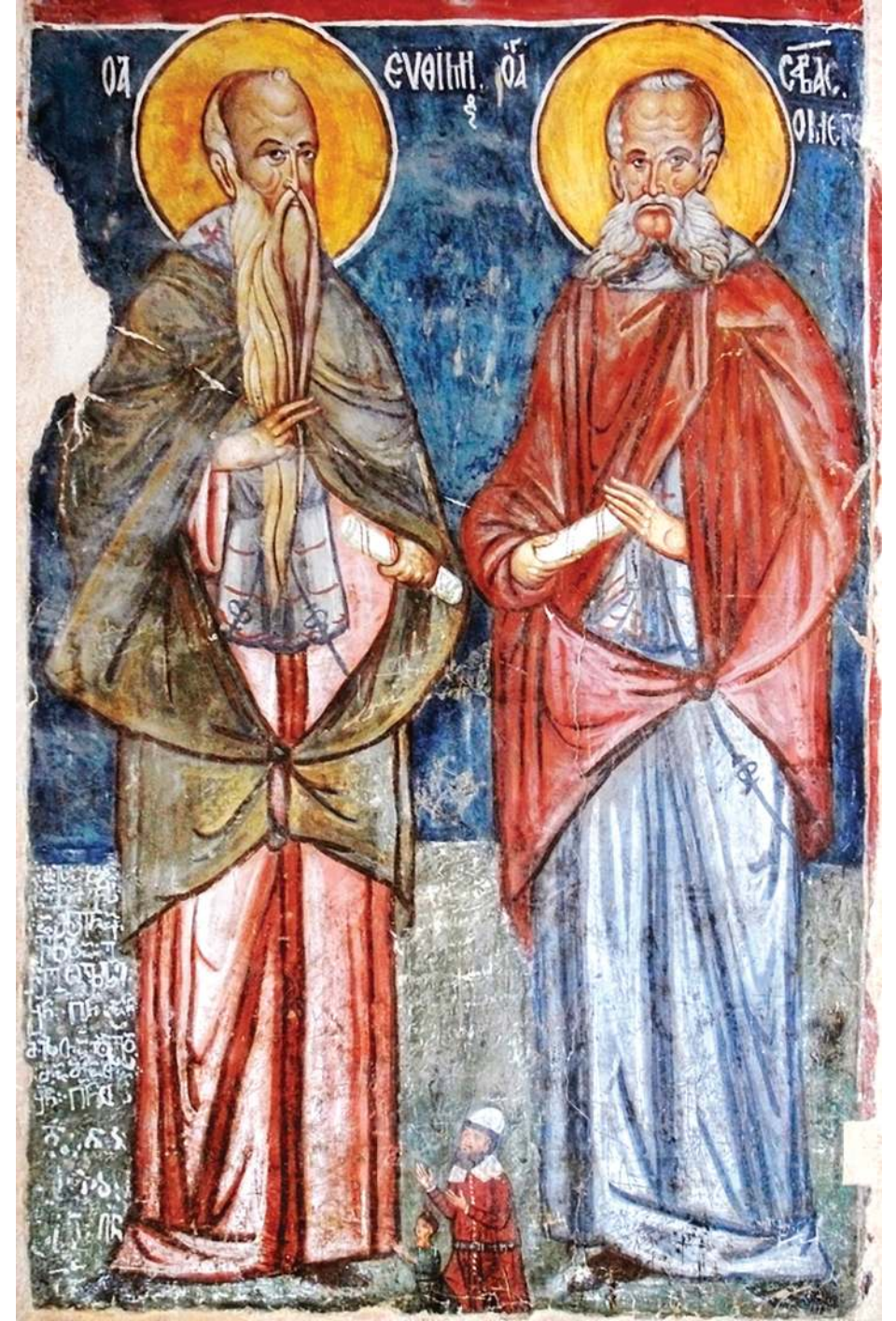
იერუსალიმის ჯვრის მონასტრის ფრესკა წმ. საბა განწმედილი და წმ. ექვთიმე დიდი

არეოპაგიტუალმა მოძღვრებამ დიდი გავლენა მოახდინა შუა საუკუნეების ქართულ ფილოსოფიურ აზროვნებაზეც. იგი ქართულ ენაზე თარგმნა ეფრემ მცირემ XI-ის საუკუნის მეორე ნახევარში. მეცნიერებაში დაგროვდა უამრავი მტკიცებულება, რომ დიონისე არეოპაგელი არ იყო არეოპაგიტული თხზულებების ავტორი. დადგინდა, რომ ეს თხზულებები დაიწერა V საუკუნის დამდეგს ქალაქ დასის მახლობლად. თხუთმეტი საუკუნის შემდეგ საიდუმლოებით მოცული ავტორის ვინაობას მიაკვლია ქართველმა მეცნიერმა შ. ნუსტუბემ (1888-1969). 1942 წელს მან წამოაყენა თეორია, რომ ავტორი არეოპაგიტული თხზულებების არის V საუკუნის დიდი ქართველი მოაზროვნე ჰეტრე იბერი. ათი წლის დაგვიანებით, 1952 წელს გერმანელმა მეცნიერმა ერნესტ ჰონიგმანმა (რომელიც იმ დროს ბელგიაში მუშაობდა, როგორც ბელგიის აკადემიის წევრი) შალვა ნუსტუბემისაგან სრულიად დამოუკიდებლად იგივე თეორია წამოაყენა. ამ ზრობლემას პროფ. ს. ენუქაშვილმა მიუძღვნა თავისი კაპიტალური ნაშრომი – გამოსცა ჰეტრე იბერის