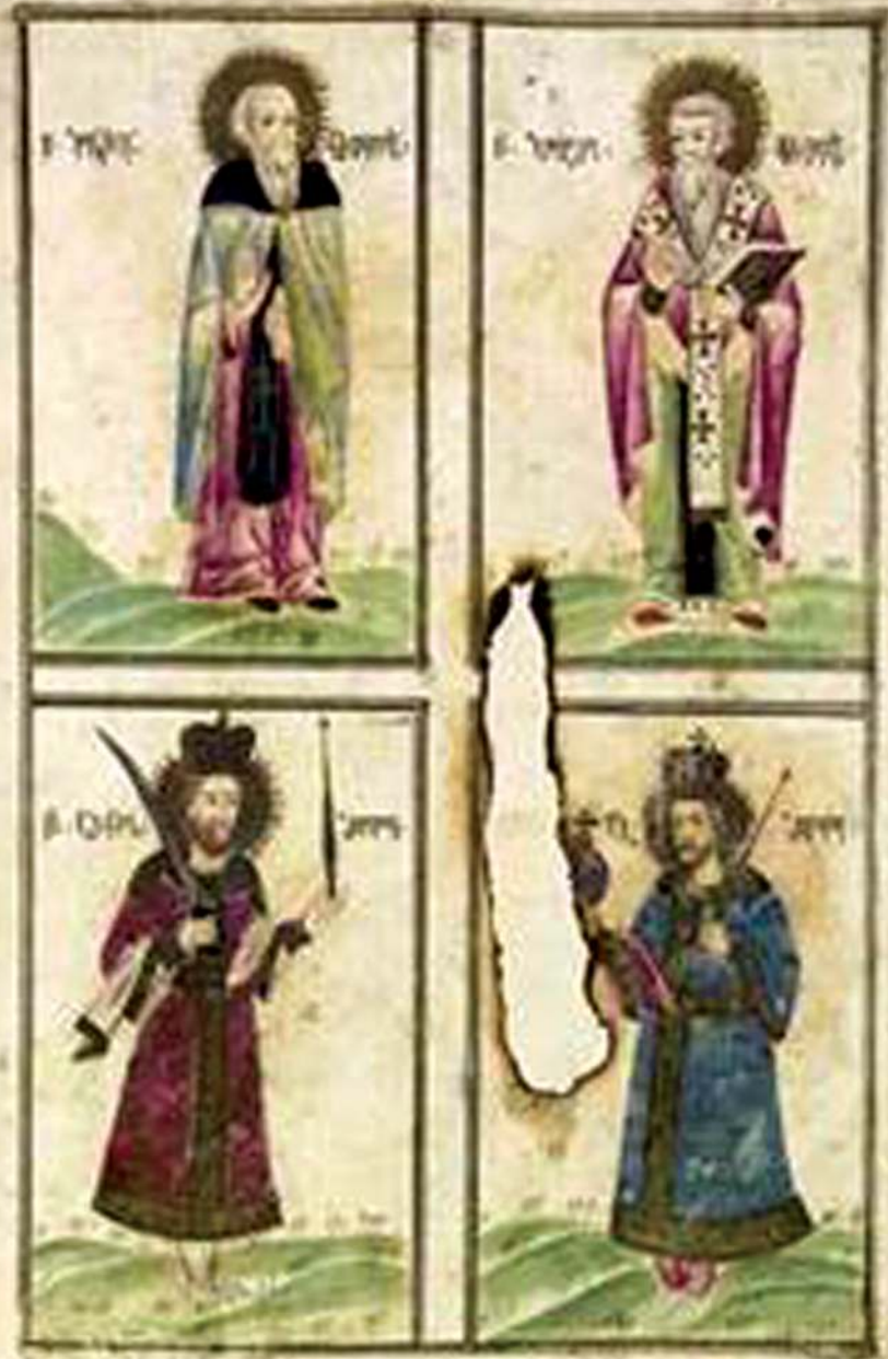
წმ. ილარიონ ქართველი, წმ. ჰეტრე ქართველი, წმ. არჩილ მეფე და წმ. მეფე ლუარსაბი. XVIII-ის მინიატურა.

ვითარითაჲ შესწმიტა ვაქებდეთ ღირსად, ანუ რომლითა გალობითა უგალობდეთ ჩუენ მღვდელთ-მოძღუარსა ჰეტრეს, მნათობსა სოფლისასა, და სიქადულსა ქართველთა ერისასა და უმეტეს ქალაქისა მოამისა, და მრგულივ პალესტინესა, და ალექსანდრიასა, და ეგვიპტეს, სკიტეს და თებაიდასა, რომელსა შინა იღუაწა ღუაწლი სათნოი ღმრთისაი და მოჰყინა მდიდრად სასწაულნი და კურნებანი და აწ მეოხ არს ჩვენთვის უფლისა მიმართ.