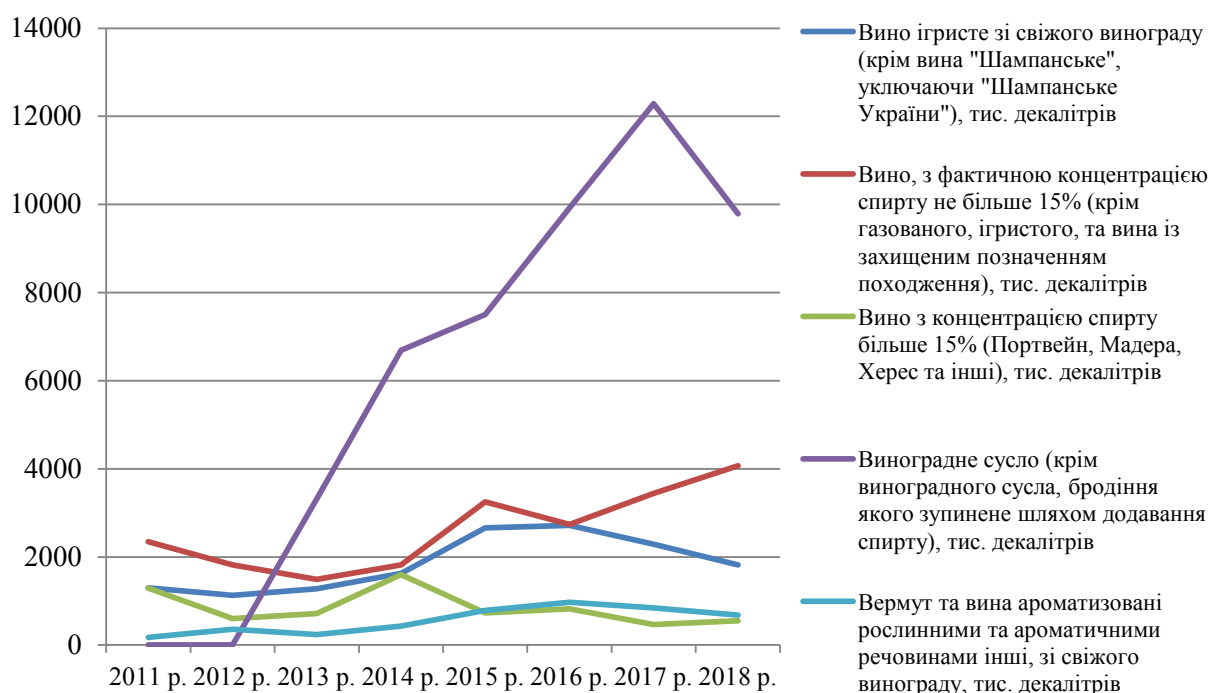
Рис. 2. Динаміка виробництва вина та виноградного сусла в Одеській області в 2011–2018 рр., тис. дек.

Аналіз структури виробництва вина та виноградного сусла в Одеській області в 2017–2018 рр. показує, що найбільша частка належить виноградному суслу (крім виноградного сусла, бродіння якого зупинене шляхом додавання спирту), яка