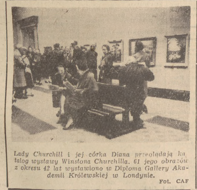
Lady Churchill i jej córka Diana przeglądają katalog wystawy Winstona Churchilla. 61 jego obrazów z okresu 42 lat wystawiono w Diploma Gallery Akademii Królewskiej w Londynie.

Niestety — rozważania i dyskusje, prowadzone na warszawskim spotkaniu dziennikarzy i przedstawicieli przemysłu motoryzacyjnego, nie dają tu wielkich nadziei. Fabryki motocyklowe nie myślą w tej chwili o przedstawieniu produkcji i wytwarzaniu omawianych prostych mikrosamochodów. Nadal produkują motocykle, które ciągle jeszcze — z braku laku — mają zbyt w kraju, a które niestety na zaw sze pozostaną w naszych warunkach klimatycznych, sezonowym i wcale nie uniwersalnym pojazdem. (zbicz)