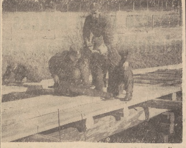
Żołnierze gdańskiej jednostki saperkiej przyszlizli z pomocą oliwskiemu Zoo, wykonując przed otwarciem nowego sezonu szereg prac saperskich i gospodarskich. M. in. żołnierze budują dwa mosty, stanowiące fragment tzw. „nowej drogi”. Na zdjęciu: saperzy przy budowie jednego z mostów, wiodącego nad wybiegiem dla zwierząt.