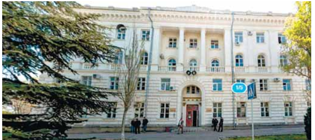
[Архитекторы В.П. Мелик-Парсаданов, Ю.Д. Фердман?], административное здание ЧФ, первоначально казарма, ул. Фрунзе, 1/5.