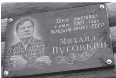
Мемориальная доска на «Кинозале Михаила Пуговкина»

Наверняка кто-то из наших читателей видел на харьковском вокзале памятник «отцу Федору» в киноплощадки Михаила Пуговкина. Кто-то фотографировался на ялтинской набережной рядом с бронзовым «режиссером Якимым», а кто-то, возможно, любовался именем артиста на Аллее звезд у ялтинского концертного зала «Юбилейный». Кто-то, может быть, успел посетить музей Пуговкина в Ливадии 4 . Но знает ли кто-нибудь, как и где увековечена память о «короле комедии» в нашем городе?