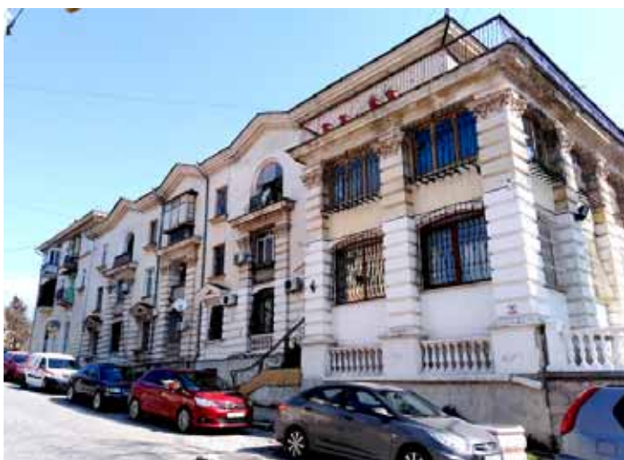
Архитектор В.П. Мелик-Парсаданов, ул. Суворова, 29, 31

Жилые дома по улицам Советской, 34, 51, 53, 55, Суворова, 29, 31; Терещенко, 16, 18, построенные в первой половине 50-х годов для моряков Черноморского флота, представляют собой реализацию крупномасштабных проектов целых кварталов многоквартирных домов с полным благоустройством территории. Об этом подробно сказано в пояснительных записках к проектам. А сами сады, подпорные стенки и лестницы вычерчены со всеми малыми архитектурными формами: скамьями, декоративными вазонами и даже шаблонами для их изготовления. Все фасады этих домов разные и до сих пор привлекательные, хотя в чертежах проектов были некоторые иные варианты их детализации, так и оставшиеся на бумаге. Например, в документации по северной части жилого квартала, расположенного между улицами Сергеева-Ценского, Советской и Суворова, имеется такое предписание со стороны заместителя главного архитектора города: «На территории, отводимой под застройку, имеются разрушенные строения бывших жилых домов, подлежащие разборке, и каменный сарай для дров, который также полегит сносу. Помещения для дров жильцов дома... должны быть предусмотрены в цокольных этажах новых домов. Взрослые деревья, попадающие под застройку, должны быть пересажены на новые места...»