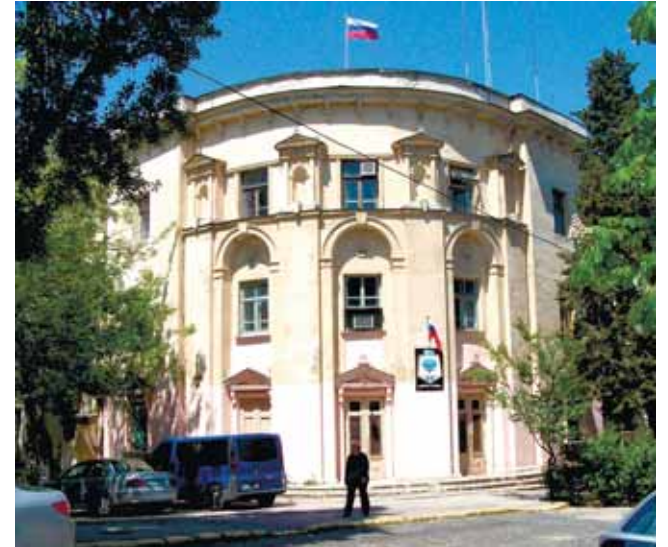
Здание Отдела гидрографии Черноморского флота (ул. Суворова, 4/2)