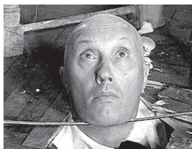
Этот эпизод в фильме «Д'Артаньян и три мушкетера» принес актеру всеобщую славу