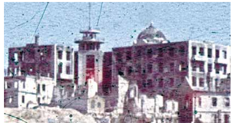
Отдел гидрографии Черноморского флота до реконструкции. Немецкая фотосъемка военного времени.