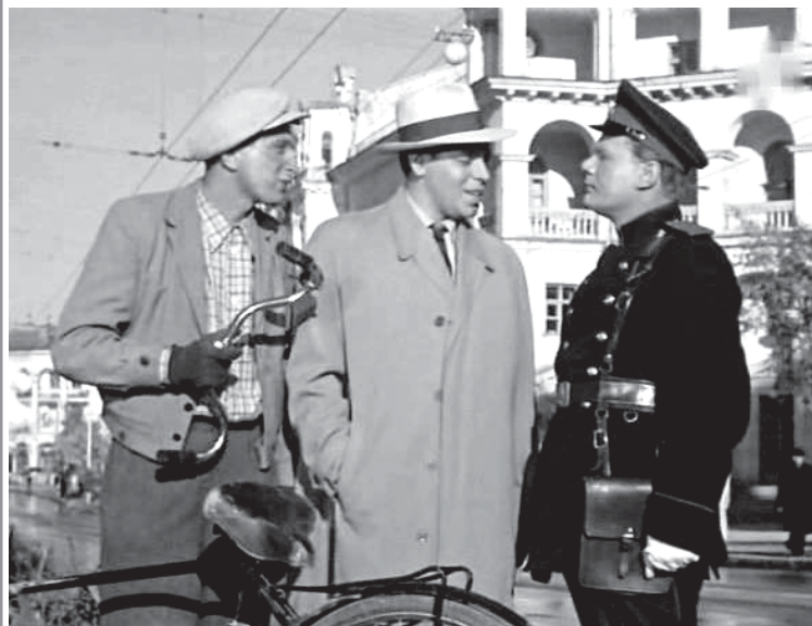
Михаил Пуговкин любил вспоминать, как в 1954 году снимался в Севастополе вместе с Аркадием Райкиным. Как называется их совместный фильм (см. фото)? Где стоят герои Райкина и Пуговкина?

Ответы принимаются в течение месяца со дня выхода рубрики по адресу: sev_izv@mail.ru . Правильные и наиболее интересные будут помещены в следующем выпуске. Самые активные участники викторины в конце года получают памятные подарки.