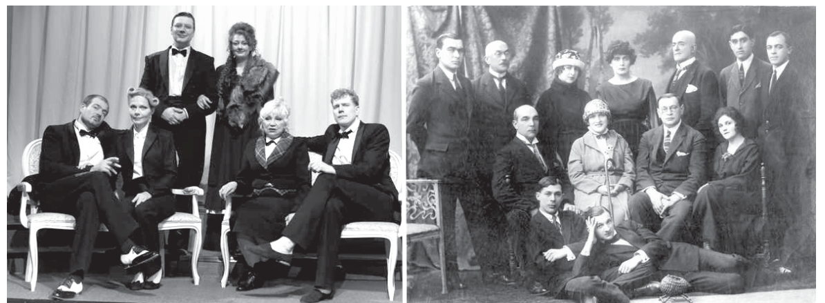
Возрожденная театром «Сфера» (слева) и подлинная труппы «Гнезда перелетных птиц»