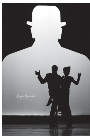
Фантазия на фоне задника спектакля по произведениям Аркадия Аверченко «Под холщовыми небесами».