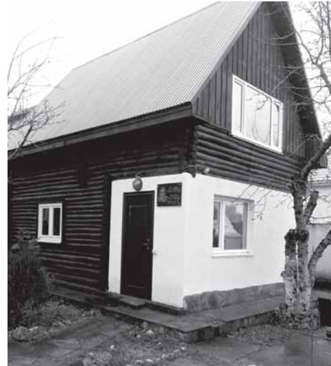
«Домик Пуговкина» с мемориальной доской.