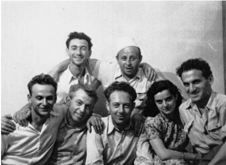
במחנה העבודה ביוגוסלביה

הסימאות מביטות מעל ההרים, הרכבת עוברת ביעף. מקבילות את פנינו אלפי ידיים מנפנפות, שהמירו רובה באת. הכתפיים הערומות מתכופפות על המריצות – כתפיים, אשר הפאזיזם לא עצר כוח לכופפן.