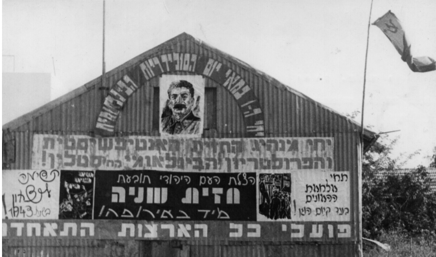
מועדון המפלגה הקומוניסטית בנתניה, ה'ז במאי 1943

בים של דם, במערכה מלכדת למען החיים של כל העמים בעולם, התחשלה הברית האנטי־פאשיסטית של העמים. ההמונים בכל העולם, בייסורים ובקורבנות, ליכדו את הקואליציה הדמוקרטית, שהיא הנשק רב העוצמה שלהם, כדי לשים לאל את היוזמה של חיות הטרף החומות. ביבשה, בים ובאוויר, מנהר הוולגה ועד לנהר בוג, מאל־עלאמיין ועד ארטונה, לאורך אלפי קילומטרים, נהדפו הצבאות "הבלתי־מנוצחים" של הפיהרר איש הדמים. הפאשיסטים פתחו את שנת 1943 בגיוס כללי. הצבא האדום המשחרר הצעיד אותם מערבה. פעמיים פתחו הפאשיסטים באופנסיבה כללית: בקיץ בקורסק, ובחורף בקייב. בשני המקרים, הצבא האדום הניס אותם וחיסל אותם כליל, גם את הטכניקה וגם את החיילים.