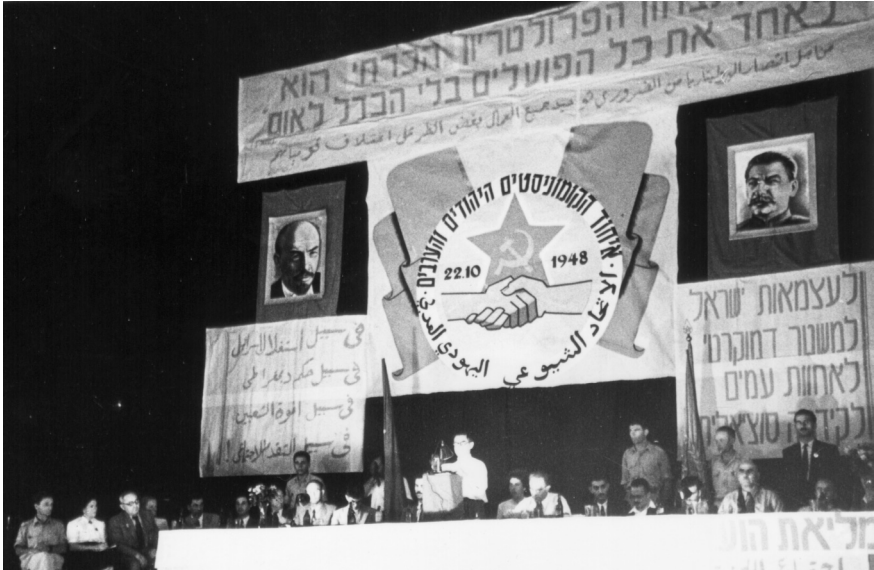
נשיאות כינוס האיחוד של הקומוניסטים היהודים והערבים, קולנוע מאי, חיפה, 22 באוקטובר 1948

הר הכרמל – גוש שחור ענק על הרקע הכהה של שמי הלילה. אי-משם מלמטה נישאת נשימתו הצוננת של הים. ראה לא תראה אלא צעדים מספר לפניך. חיפה הייתה אפלה בליל ה-22 באוקטובר שנת 1948. אווירוני האויב קרובים. הולכים אנחנו אל אולם הקולנוע "מאי".