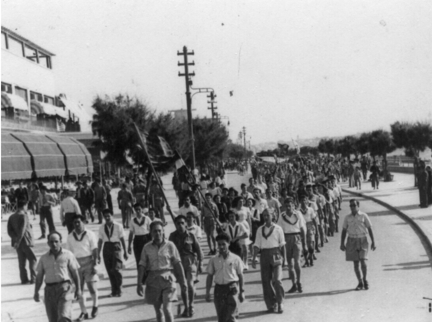
הפגנת ה־10 במאי, 1944, של המפלגה הקומוניסטית ברחוב הרברט סמואל (הטיילת) בתל־אביב אלושה – במרכז השורה הראשונה

הקו הפוליטי של רוב מנהיגי ההסתדרות הנוכחיים קובע את אופי אירגונה הבלתי־דמוקרטי של ההסתדרות. האוריינטציה של רוב זה על עזרת הריאקציה הבינלאומית אינה מאפשרת לו לנהל מאבק במונופולים; והאוריינטציה על הרכושנים, אשר יש להבטיח להם "רנטביליות" בהכנסותיהם על־ידי העלאת הנורמות והורדת השכר, דורשת לבלום את התרחבות המאבק המקצועי על הטבת תנאי העבודה, ובעיקר – לא לאפשר ערובות חוקיות ממשלתיות להישגי הפועלים על־ידי חוקת עבודה, העלולה לקשור את ידי הבורגנות והספסרים. מכאן נובע חוסר נכונותם של רוב מנהיגי ההסתדרות להילחם על חוקה סוציאלית וחוקי עבודה, והשתמטותם מלארגן מלחמה זו כמלחמה משותפת של פועלים יהודים וערבים נגד השיטות הקולוניאליות של הממשלה.