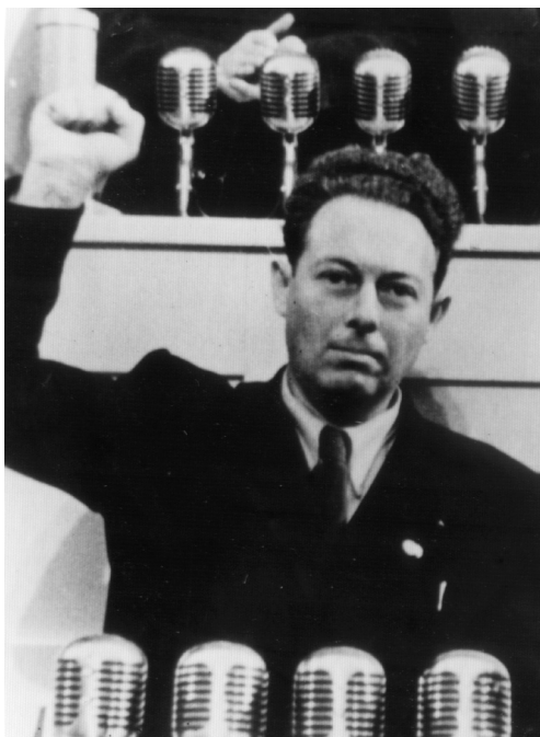
אליושה גוז'נסקי מברך את ועידת האיחוד של הקומוניסטים והסוציאליסטים בפולין, דצמבר 1948 (תמונתו האחרונה).