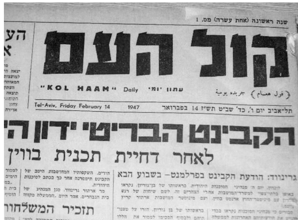
הגיליון הראשון של "קול העם" היומי, 14 בפברואר 1947

בוועידה השמינית של המפלגה הקומוניסטית הפלשתינאית (מאי 1944) נבחר אליושה לוועד המרכזי של המפלגה.