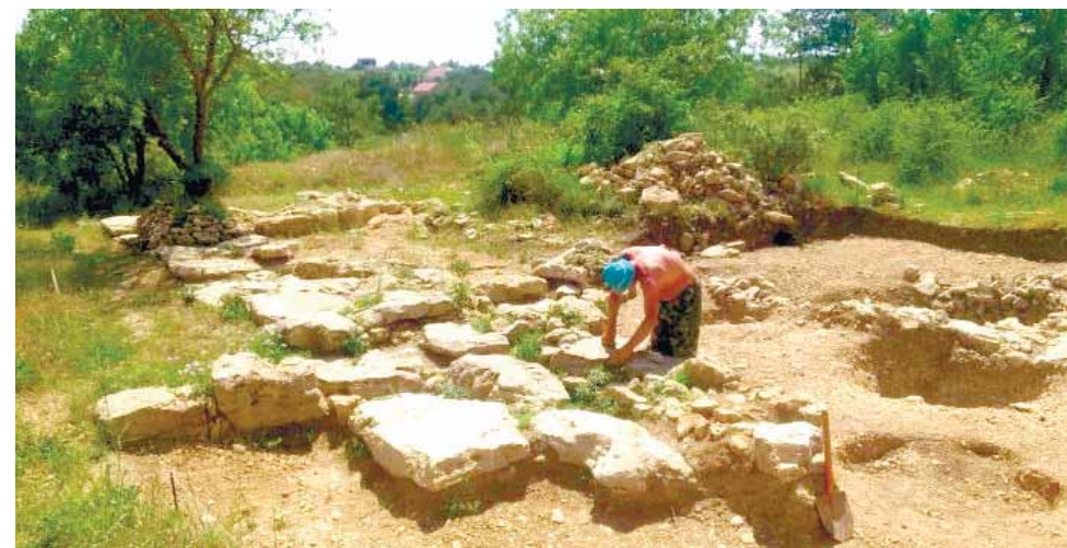
Раскопки крепости на горе Масляная

А мы отправляемся к еще одному оплуту римлян – теперь уже на горе Казац-