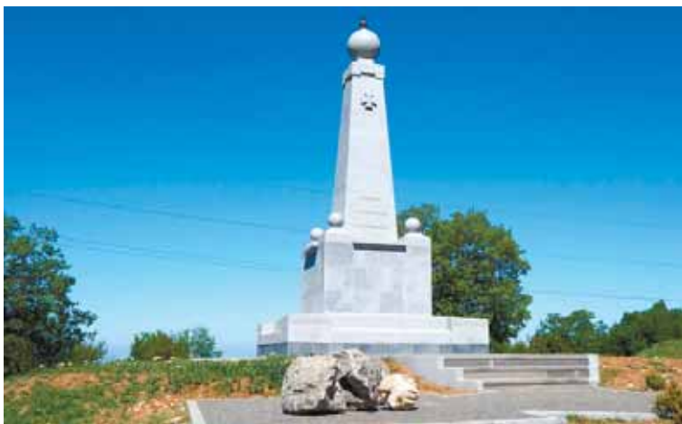
Памятник Инкерманскому сражению на высоте Суздальская. Слева – место раскопок римского лагеря II-III в. н.э.

Оба укрепления стояли возле дороги, ведущей в Херсонес, и охраняли подходы к нему от нападения тавров и скифов вплоть до середины III века. Дорога проходила через Сапун-гору и спускалась в район Инкермана, а далее вела в Альминскую долину, где заканчивались херсонесские владения римлян. Ныне там располагается село Заветное. Дороги римлян, усиленные военными постами, вели в Балаклаву, а далее, по одной из версий, пересекая Байдарскую долину, забирались в горы и через перевалы уходили на Южный берег Крыма – там стоял форпост Римской империи, крепость Харакс, где высился маяк.