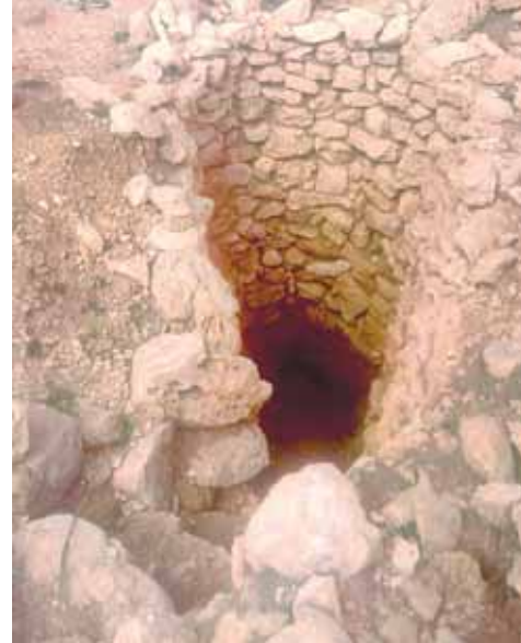
«Колодец», гора Масляная