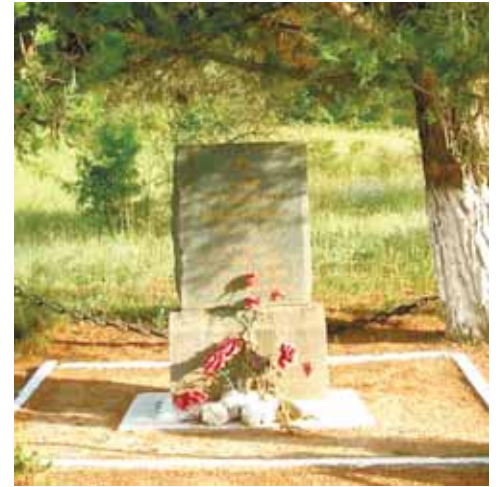
Памятный знак 4-го сектора оборонительного района

в сон. И только в XII веке это место привлекло половцев. Причем оно стало для степняков священным! Здесь, прямо на эллинических развалинах, они возвели святилище. В 2013 и 2014 годах объект на горе Масляной исследовал А. Филиппенко, который обнаружил четыре изваяния из известняка XII-XIII вв. На двух сохранились изображения ног и декорированные полы кафтанов. Один из идолов стоял на родосской амфоре! Бродя среди внушительных развалин, мы нашли странный «колодец», в который спускались 12 ступеней. Оказалось, там было обнаружено половецкое погребение: подрасток, лежавший в скорченном положении головой на восток.