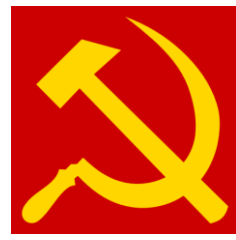
Hammer og sigd Hammer and sickle

Men straffebestemmelsen skal selvsagt ikke ramme enhver kritikk mot personer, religion eller livssyn. Det skal være tillatt å ha en «fri og åpen religions- og kulturkritikk». Det straffbare skal dermed være innenfor en grensdragning mot de «grunnleggende menneskerettigheter som menings-, ytrings- og organisasjonsfriheten» 17 .