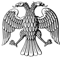
Dobbeltørn Double-headed eagle