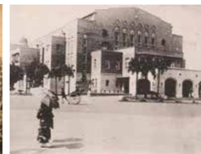
▲1940年臺北公會堂。