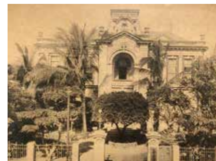
▲臺南公會堂。

公會堂建築是臺灣都市近代化與殖民需求下而出現的建築類型，其設置與都市或聚落發展息息相關，此類型建築的研究可了解臺灣日治時期「半官方」類型的建築形式，也可藉由探索興建過程一窺「半官方」組織的運作。☞