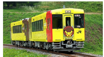
POKEMON with YOU トレイン

https://www.jreast.co.jp/railway/joyful/pokemon.html