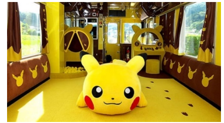
プレイルーム車両