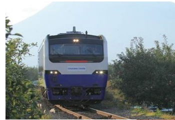
キハ48形 (クルージングトレイン)