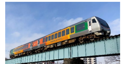
リゾートあすなろ

https://www.jreast.co.jp/railway/joyful/asunaro.html