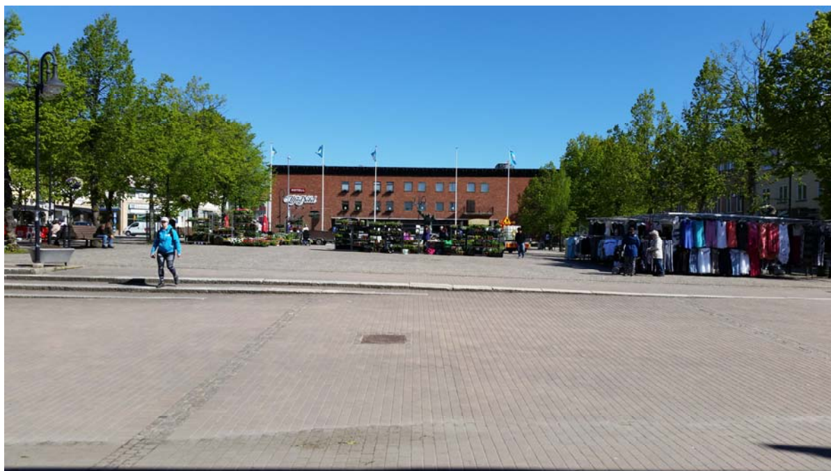
Alfred Nobels torg sett från söder