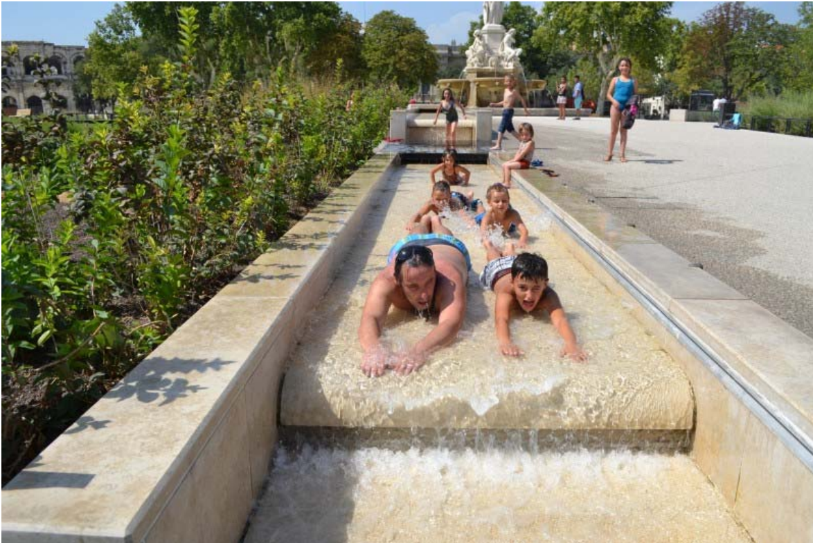
Olika aktivitetsredskap kan utformas så att de blir vackra inslag på ett torg (Nimes, Frankrike)