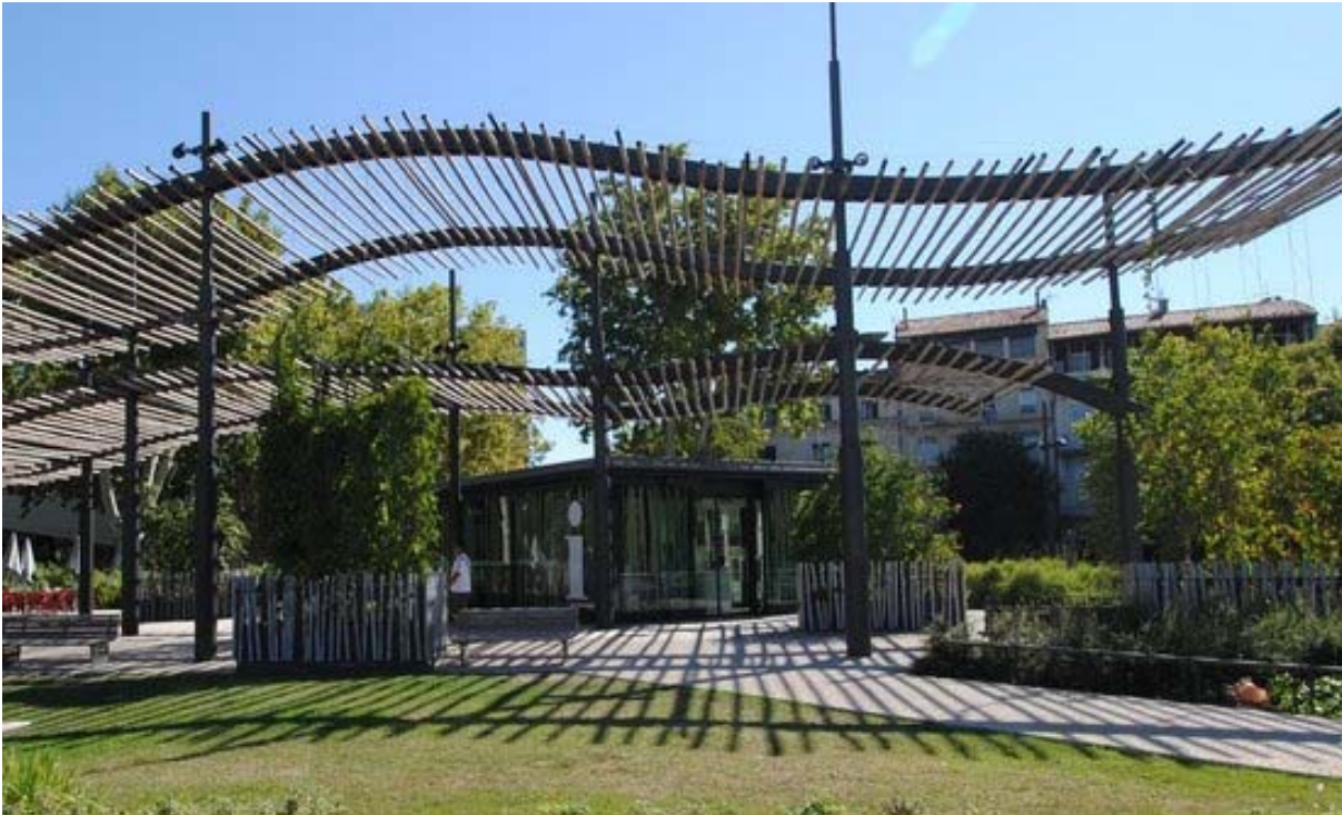
Gröna växter kan, tillsammans med skyddstak och spaljéer, bilda behagliga platser på ett torg (Nîmes, Frankrike)