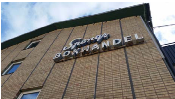
Neonskyltar tillhör den tid då Torget blev till.