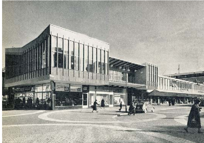
Vällingby torg c:a 1955