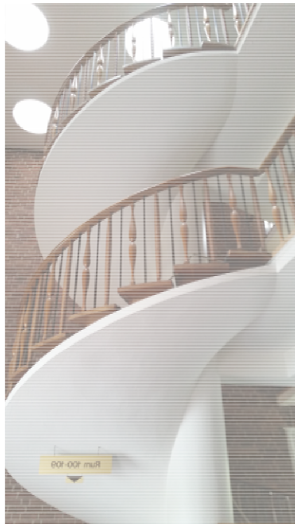
Detalj i Alfred Nobels Hotell (f.d. Stadshuset).

En skulptur har inbyggd vattenfontän. Det finns tillgång till vatten och anslutningspunkt för brandvatten samt dagvattenbrunnar. Belysningen utgörs idag av ett tiotal c:a 4 meter höga stolpar med traditionella armaturer samt någon högre stolpe med allmänbelysning. Det finns uttag för elektrisk kraft.