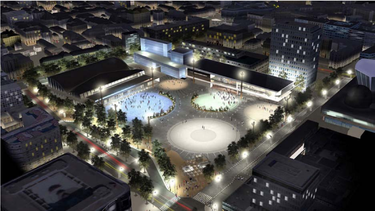
Ett kraftfullt modernt torg kan skapas genom stora geometriska former på och i marken (Rennes, Frankrike)