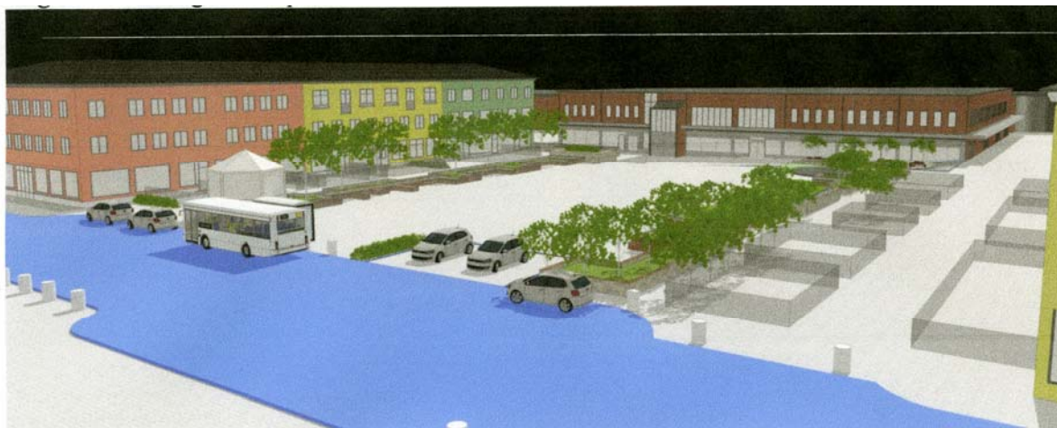
Vy från nordväst