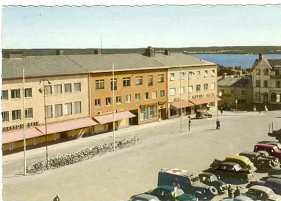
Torgmiljön i Karlskoga vid tiden för dess tillblivelse 1940

Bebyggelsen vid torget består av tvåvånings byggnader med källare inrymmande i huvudsak kommersiell verksamhet i markplan och bostäder i övre plan. Vid torgets södra sida ligger en del av det stora butikskomplexet Kulan (tidigare K-Center) och vid den norra sidan ligger Stadshotellet/Stadshuset (numera Alfred Nobel Hotell) med tvåvånings fasad mot Torget. Samtliga dessa byggnader är utförda i modernistisk stil från 1940-1980.