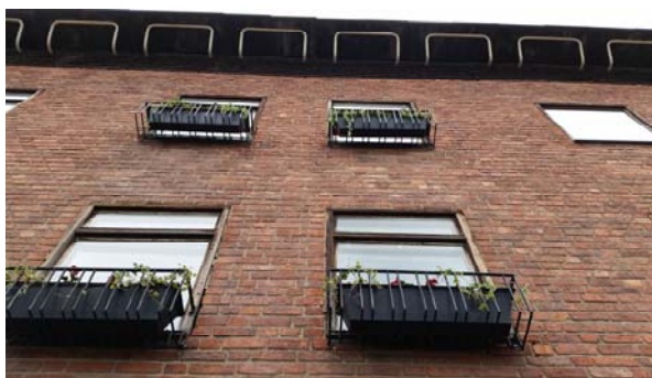
Stadshuset är en av länets vackraste byggnader.