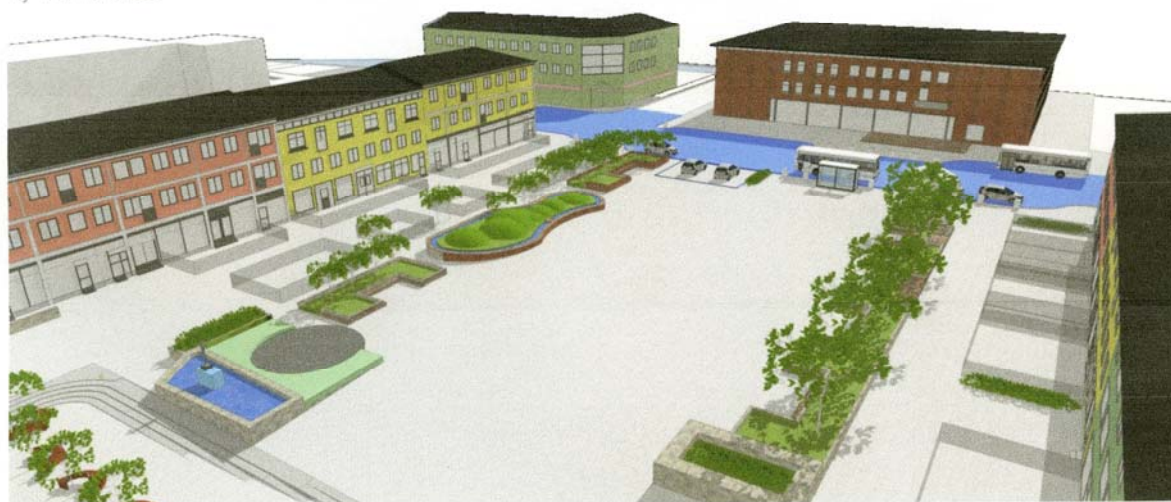
Vy från sydost

Illustrationsskiss – Utformningsförslag för Alfred Nobels torg (okt 2016)