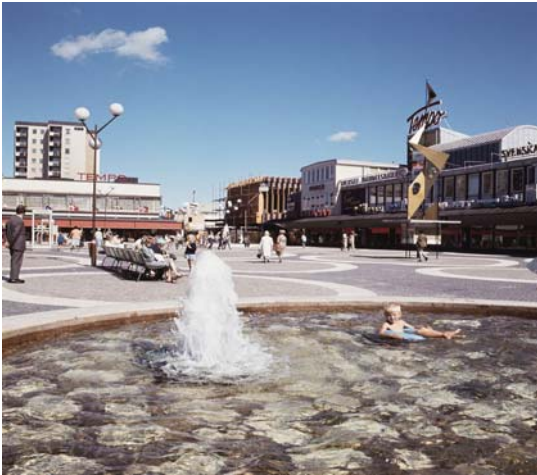
Vällingby torg c:a 1970

1950-talets mer påkostade ”funkistorg”, t.ex. i Stockholms förstäder, utformades som konstverk i sig själva med funktionella delar samt storskalig modern konst av typen geometriska figurer och former. Man kan som exempel nämna Vällingby torg, Årsta torg och Hökarängen i Stockholmsområdet.