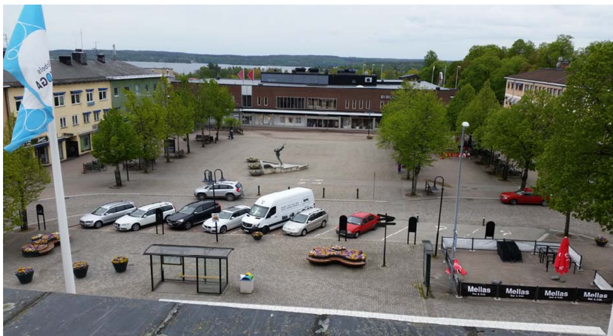
Alfred Nobels torg sett från taket på f d stadshuset.

Detta programförslag utgör övergripande riktlinjer för den framtida utformningen av Torget och baseras på de idéer som kom fram i medborgardialogen samt samhällsbyggnadsförvaltningens bedömning. En noggrannare sammanfattning av de önskemål som framkommit i medborgardialogen finns att läsa i Bilaga 1, "Förslag till utformning av Alfred Nobels torg".