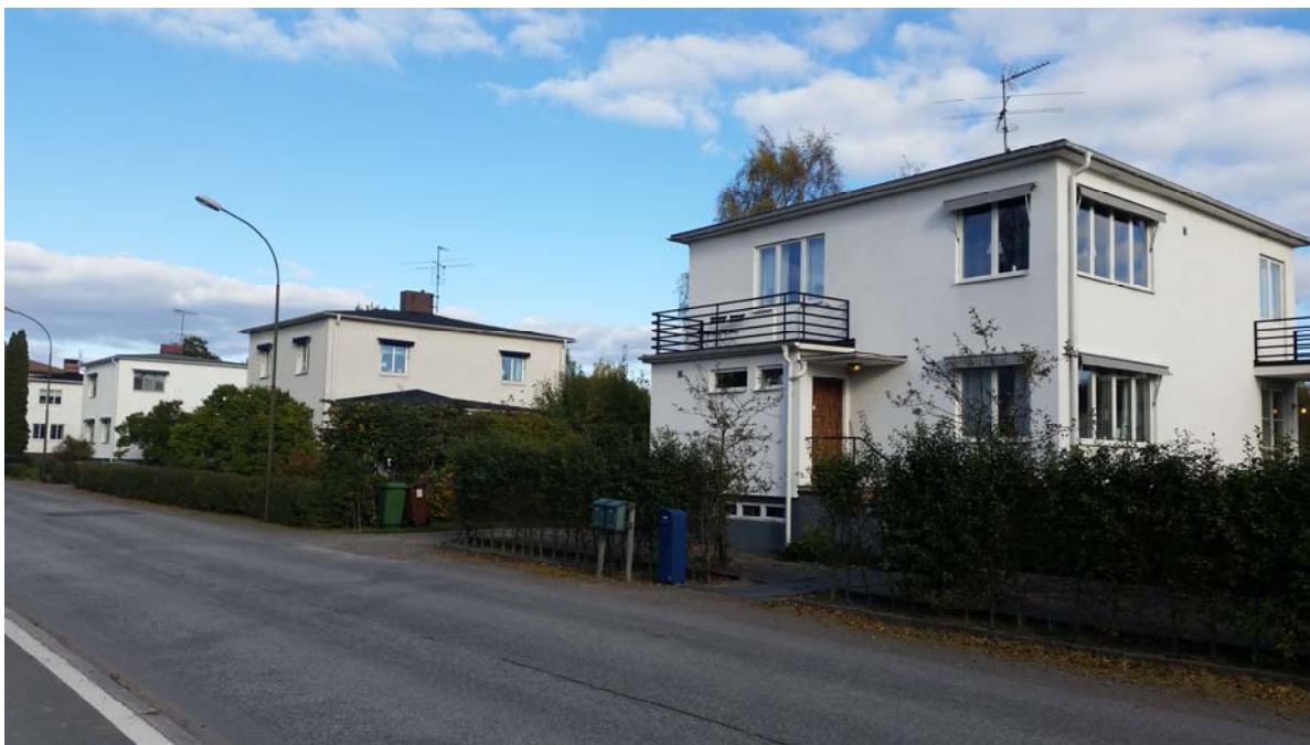
Bostäder i funkisstil (modernism) i Norra Bohult.

Norra Bohult (funkishus vid Karls Åby) c:a 600 meter nordost om Torget, utgör nationellt riksintressen för kulturmiljö.