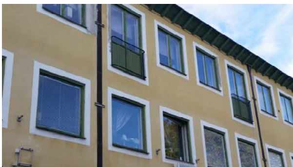
Vid Torget finns fina, väl utformade moderna byggnader och parker som ger avkoppling.

Torget omgivning är ett tydligt uttryck för den regionalt färgade modernism/funktionalism som präglade den tid då Karlskoga blev stad, 1940. Denna byggnadsstil och kulturmiljö utgör en intressant och vacker helhet som dominerar hela Karlskoga stad och är en stor tillgång för Karlskogas invånare och besökare. Torget uppfattas som en del av denna helhet men har trots detta aldrig haft någon typisk "funkisstil" utan fick efter 1940 fortsätta att vara ett platt salutorg med parkering, något som är vanligt i mindre städer. Det fick ingen särskild uttänkt beläggning, utsmyckning eller möblering. Vid ombyggnader genom åren har olika typer av estetiska och funktionella delar tillkommit som delvis inte stämmer överens med områdets ursprungliga karaktär. Byggnaderna är i gott skick med ursprunglig utformning, förutom vissa förvanskade detaljer. Butiksskyltarna har förändrats och ger ett splittrat intryck.