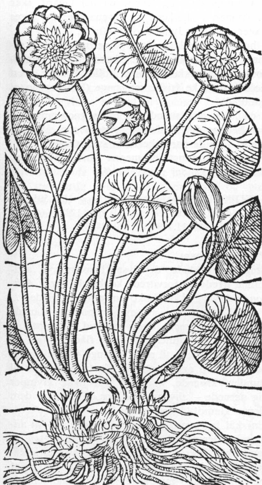
Nøkkerose og gul åkande. Simon Paulli: Flora Danica , 1648.

Christiern Pedersen 1533: ølafkog af »åkanderod« eller destilleret vand af blomsterne drikkes for at modvirke »den onde begæring og ukysk-