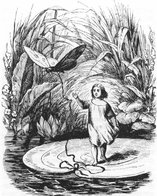
Tommelise på åkandebladet. Tegning af Vilhelm Pedersen til H. C. Andersens eventyr »Tommelise«.

Nøkkerose 1769ff lånt fra norsk, hvor nøkken er et sagnvæsen af hankøn, som bor i søer og elve. »I ordet 'nøkkerose' for ... den største af alle danske blomster gemmes navnet på nøkken, elvenes og strømmenes ånd, der i viserne drager ungersvenden og ungmøen ved sit yndige harpespil, ligesom den rislende bæk drager os med en lønlig magt« (2); gribes en badende af krampe eller bliver hængende i vandplanternes seje, slimede stængler, er det nøkken, som vil tage ham – de lumske dammes skønne hvide vandliljer kaldes derfor nøkkeroser Gudmund Schütte (3).