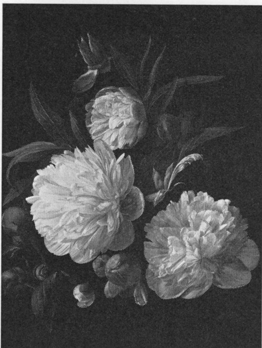
Bonderoser malet af C. Balsgaard, 1846.

Det gav sygdom i besætningen og uheld overhovedet at forære havens pæoner væk (Odsherred; 19), blev de flyttet, måtte man være forberedt på et snarligt dødsfald (Fakseegnen); den måtte ikke tages med, når man flyttede til en anden gård (Skagen) (20).