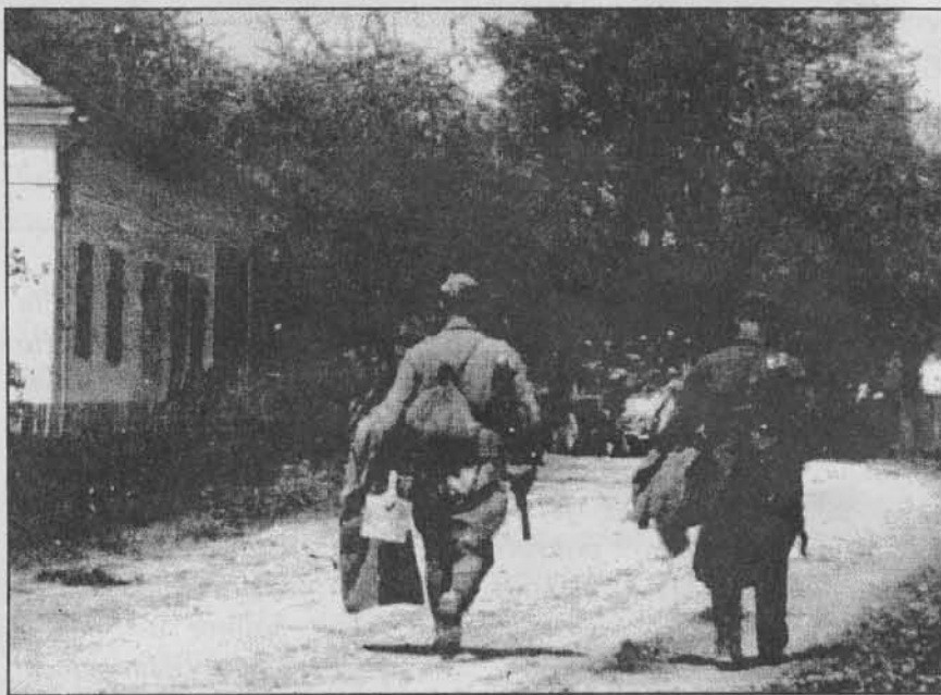
Ulice směrem k hlavnímu nádraží, pohled k Panence Marii, Foto: V. Sural 1945

brigády. O ostatních jsem se nedozvěděl nic ani od opozdílčů, kteří se trousili až do úplné tmy. Byl mezi nimi také náčelník štábu brigády, štábní kapitán dělostřelectva Hlásný. Noc byla zlá. Spali jsme příkrčení mezi kleč v mokrých šatech. Lidé se zimou budili a opět usínali nepřirozeným křečovitým spánkem, jímž snad chtěli zapomenout na to, že ještě vůbec žijí...". Není tedy pochyb o tom, že další činnost brigády v německém obklíčení byla jiná, nežli u ostatních jednotek sboru, bojujících již při ústupu Němců okolo