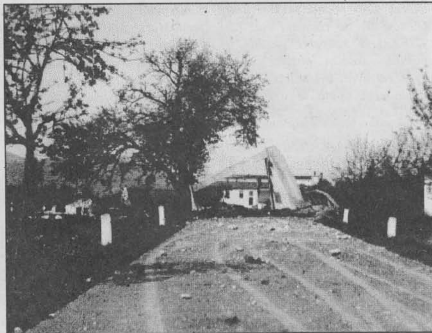
Vyhozený most u bludovského mlýna - pohled od Postřelnova, Foto: V. Soural 1945

August Habermann přebudoval od nepaměti mlýn námezdní na mlýn obchodní. V roce 1920