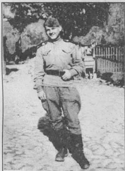
Osvoboditeľ Bludova.