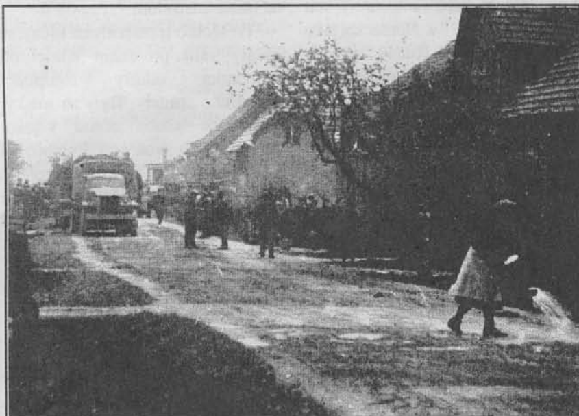
Pohled od P. Marie k hlavnímu nádraží

fašistickou perzekucí a na potřeby odboje, na šíření ilegálních tiskovin, na pomoc uprchlým válečným zajatcům. Bludovská skupina se připravovala i na ozbrojený boj proti okupantům. Byly vykopány bunkry pro úkryt partyzánů, vyráběny granáty. Již v r. 1943 se tu skrývala část odbojářů.