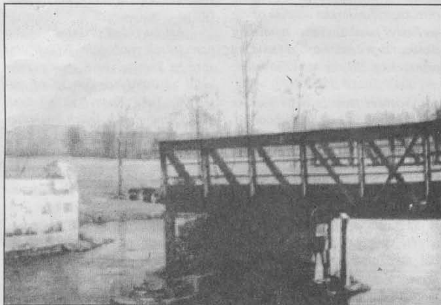
Vyhozený most u Chromče. Foto V. Soural 1945

V pondělí jsem manželku s dětmi odvedl do vesnice ke Konečným, paní Strašilová s dětmi rovněž odešla na Horní konec k Janíčkovým. V pondělí odpoledne - blížila se střelba - měli jsme v úmyslu přenocovat venku v prostoru mezi náhonem a Moravou. Když nám začaly svištět střely nad hlavou, já a Strašil jsme se vrátili domů, Rauchovi a Dospiva přenocovali v přípravně vepřína. V úterý ráno 8. května jsme postávali u verandy, která dostala dělostřelecký zásah. Omítka a cihly padaly na naše hlavy. Uchýlili jsme se proto do vedlejšího sklepa.