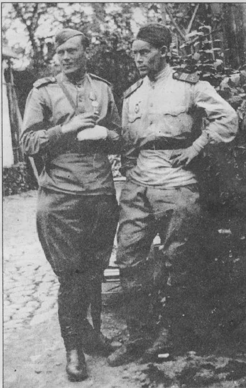
Osvoboditelé Bludova, Foto: V. Soural 1945