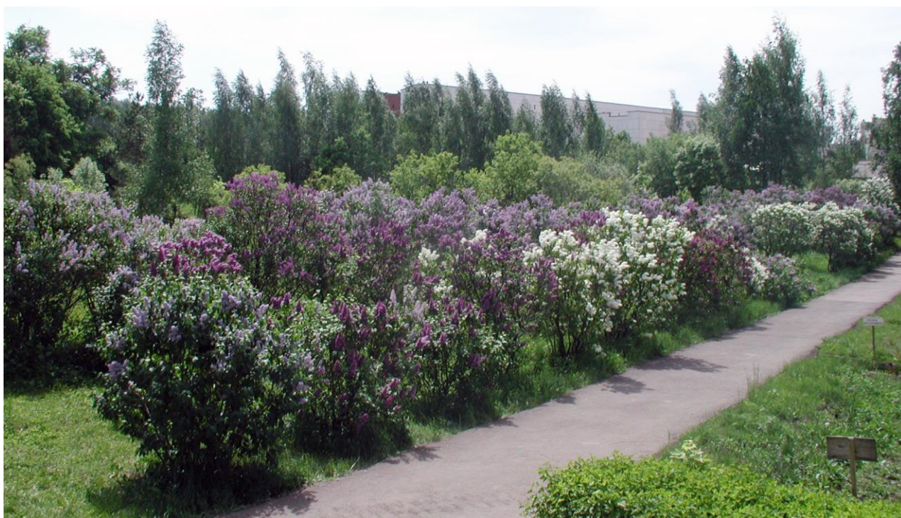
Рис. 9. «Аллея Сахаровой» в Ботаническом саду в г. Уфе

В 1982 г. сотрудники ботанического сада решили сконцентрировать все сорта сирени, выведенные Сахаровой, на одном участке. Как рассказал дендролог Р.В. Вафин, Александру Сергеевну пригласили для консультаций, и она сама участвовала в посадках. Сейчас этот великолепный участок сирени носит название «Аллея Сахаровой» (рис. 9). Кстати, из всех сортов сирени в коллекции ботанического сада (включая зарубежные), самым лучшим, благодаря исключительной красоте и пышности цветения, Сахарова считала «Красавицу Башкирии». К несчастью, именно этот сорт оказался утраченным к началу 1990-х годов (на рис. 7 изображен довольно схожий по признакам гибрид № 209, имеющийся в коллекции). Но в связи с тем, что после создания аллеи многие садоводы-любители получали отсюда черенки сортовой сирени, остается надежда, что «Красавицу Башкирии» может быть когда-то удастся найти.