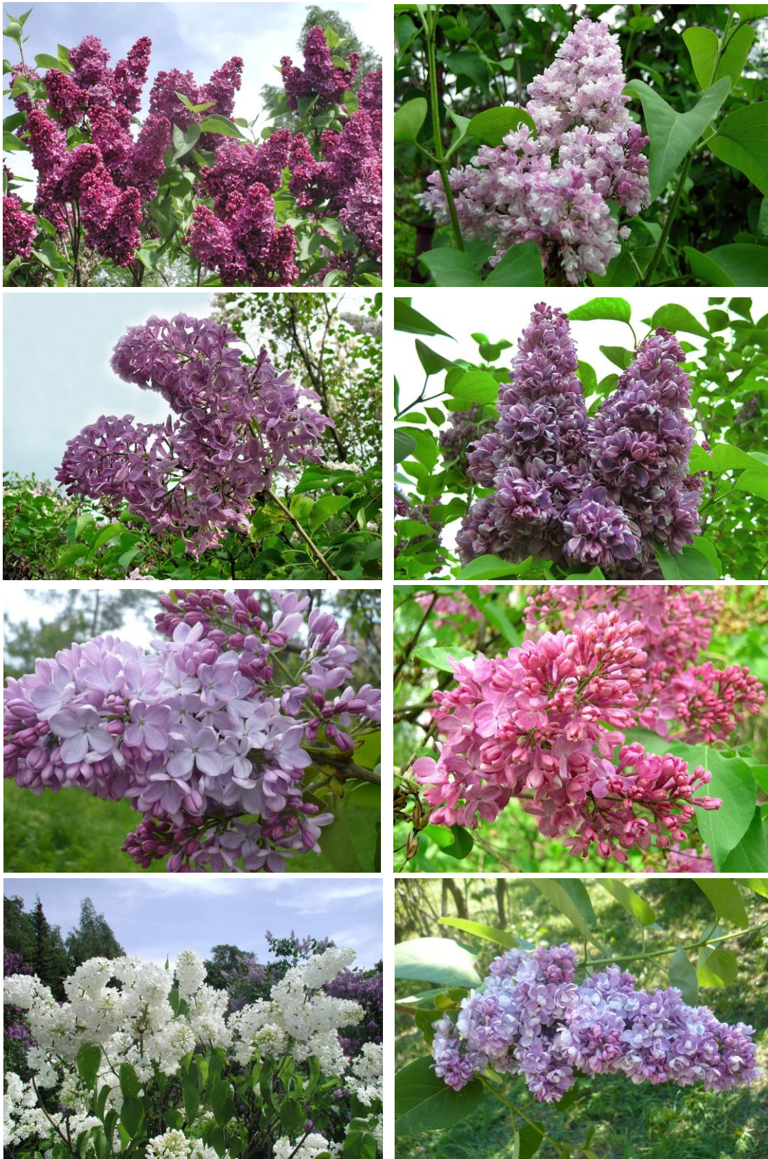
Рис. 7. Сорты сирени селекции А.С. Сахаровой (верхний ряд слева – «Алеша», фото Р.Ю. Бикчентаева, справа – «Айгуль», фото автора; второй ряд слева – «Гульназира», фото автора, справа – «Салават Юлаев», фото автора; третий ряд слева – «Нафиса», фото Н.В. Поляковой, справа – «Шаура», фото автора; нижний ряд слева – «Агидель», фото Р.Ю. Бикчентаева, справа – аналог «Красавицы Башкирии», фото Н.В. Поляковой)