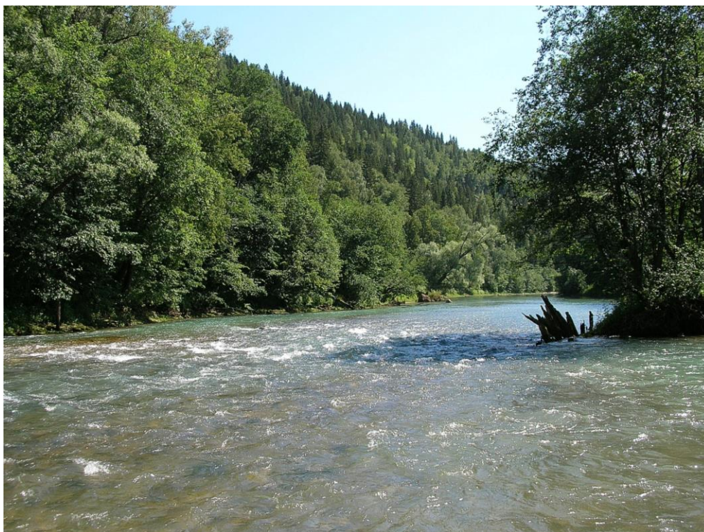
Рис. 2. Уфимском плато у пос. Красный Ключ

А.С. Сахарову назначили ответственным исполнителем темы: «Обеспечение возобновления ценных пород на сплошных концентрированных вырубках». Работа проводилась ею при участии известного лесоведа А.В. Письмерова под руководством старшего научного сотрудника Всесоюзного НИИ лесоводства и механизации лесного хозяйства, профессора А.В. Побединского. Полевыми исследованиями были охвачены новые районы Уфимского плато (Караидельский, Аскинский и Дуванский лесхозы в дополнение к Красно-Ключевскому).