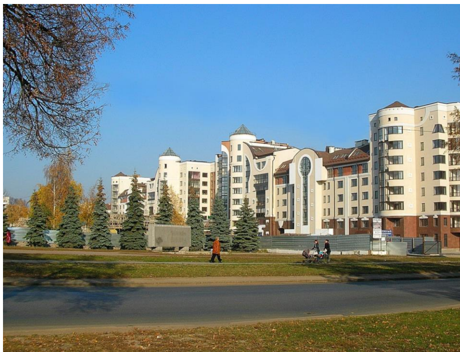
Рис. 6. Голубые ели в озеленении г. Уфы – потомки давлечановских елей

Перейдем к следующему направлению научных исследований А.С. Сахаровой – селекционной работе с сиренями [19, 25, 26, 32]. Когда Александра Сергеевна только пришла в ботанический сад, в коллекции было всего 3 вида сирени (обыкновенная, венгерская и амурская), 7 сортов зарубежной селекции и 1 поздноцветущая форма сирени обыкновенной. Уже в 1958-1959 гг. из Ленинграда, Архангельска, Горького были получены и высеяны семена 4 новых видов сирени. В 1958-1960 гг. поступили 15 новых сортов: 2-летние укорененные черенки (саженцы) из Москвы и Липецка, черенки из Киева (последние были использованы для прививок на 2-5-летние сеянцы сирени обыкновенной методом копулировки и окулировки). С 1961 г. начал создаваться специальной коллекционный участок сиреней – сирингарий, и к 1971 г. в нем уже было 16 видов и 33 сорта (в 1970-х годах появились еще 13 сортов). К началу 1970-х годов в рекомендуемый ассортимент древесно-кустарниковых растений для озеленения в Башкирии, как результат подробного изучения интродукционной устойчивости, семенного размножения и декоративности были включены 9 видов и 21 сорт сирени.