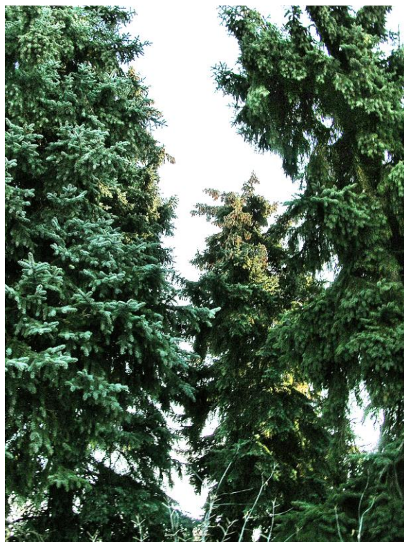
Рис. 4. Голубая ель в Давлекановском районе Республики Башкортостан (слева фото А.С. Сахаровой 1965 г., справа – фото автора, 2007 г.)

Профессор Е.В. Кучеров в книге «Памятники природы Башкирии» [6] сообщил, что впервые Давлекановский интродукционный участок голубых елей