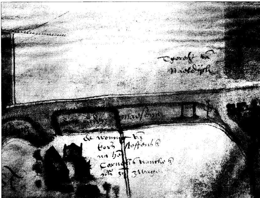
Kaart van de "Galgewoning" in Naaldwijk door Jan Jansz. Potter.

Veiligheidshalve kunnen de kaarten van Jan Potter in het kaartboek van het Oude en Nieuwe Gasthuis gedateerd worden in de jaren 1580-1590, met het accent op de jaren 1585-1590. De indruk bestaat, dat zijn werk niet af was. Dit kan wel eens de reden zijn, dat het titelblad van het kaartboek ontbreekt. Hierop vermeldt de kaarttekenaar meestal de periode, waarin hij het werk heeft verricht. Bovendien missen we nogal wat landerijen die wel jaarlijks in rekeningen van het gasthuis worden genoemd. In het kaartboek ontbreken de pagina's 1 t/m 14, 18, 22 t/m 30, 36 t/m 38 en 51 t/m 53.