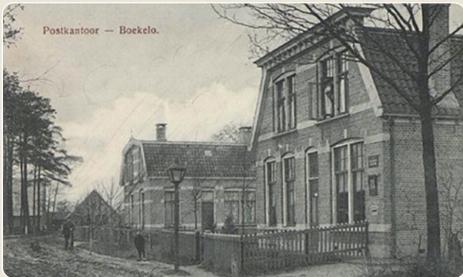
Postkantoor — Boekelo.

De wegen zyn des zomers, hoewel op vele plaatsen mul, wel door een lichte auto te beryden; in de winter echter by veel regen zyn de meeste wegen niet te beryden. Daar de streek, waar de geneesheer zyn werk zal moeten doen, een groot oppervlak beslaat, is het wel gewenscht, dat hy het motorryden machtig is. Fietspaden zyn in tamelijk goeden toestand, echter de landwegen voor auto's te slecht.”