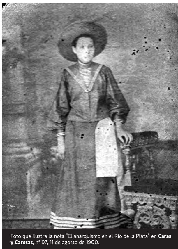
Foto que ilustra la nota “El anarquismo en el Río de la Plata” en Caras y Caretas , n° 97, 11 de agosto de 1900.

zar por casa; les dejan en libertad de pensar y obrar porque es la única manera de tener mujeres liberales y francas; les dejan en libertad porque miran en ellas un ser, una amiga, una compañera, destinada por la ley de la naturaleza (única ley ante la cual me inclino gustosa) para formar el [...] de la niñez. Si buscamos que la [...] nueva sea libre, es preciso que sepa liberarse rebelándose; siendo la mujer libre educará sus hijos conscientes de sus derechos y tendrá valor y firmeza para reconquistarlos.