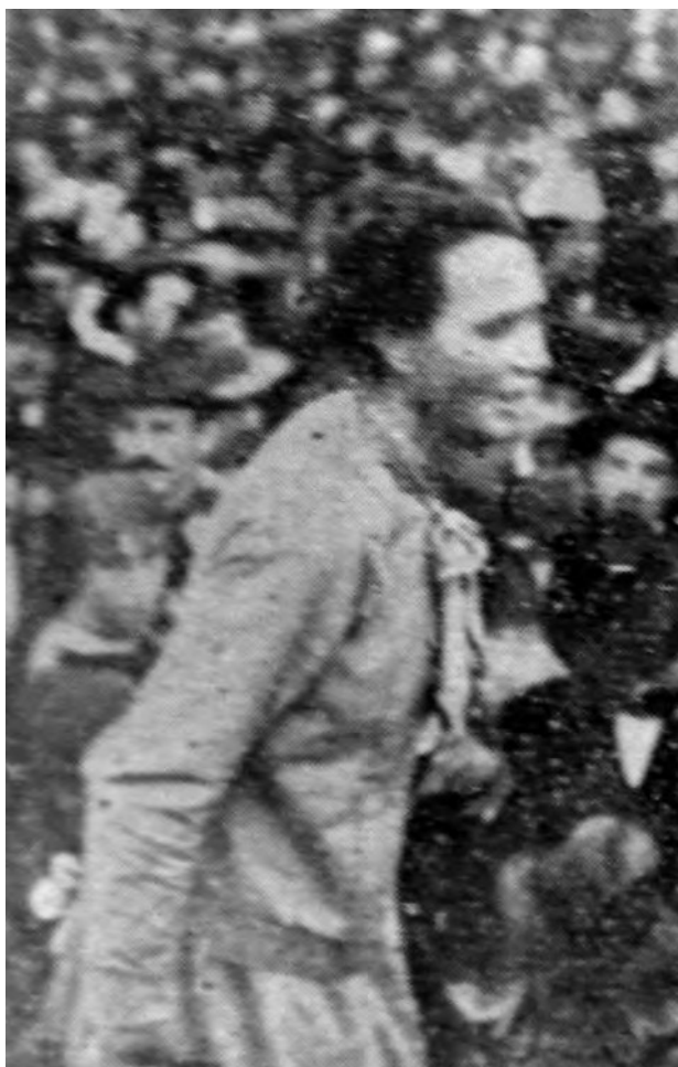
Virginia Boltén en su discurso del 1° de Mayo de 1912 en Montevideo, Uruguay.

Odiarnos los gobiernos, porque nos oprimen y nos atan de pies y manos con sus leyes, entregándonos a la burguesía como si fuéramos carneros; y reservándonos el derecho de fusilarnos como a fieras si protestamos.