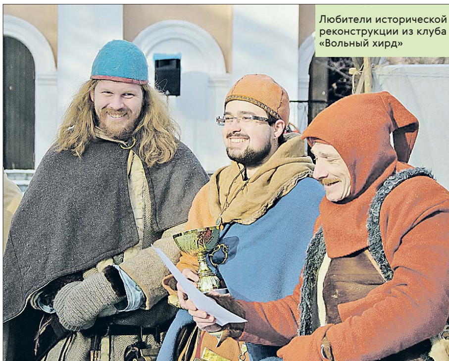
Любители исторической реконструкции из клуба «Вольный хирд»

Фольклорный ансамбль «Распев» был создан при Доме культуры «Северный»