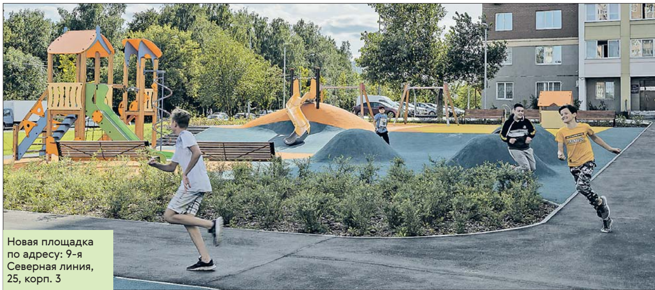
Новая площадка по адресу: 9-я Северная линия, 25, корп. 3

В результате удалось учесть потребности всех возрастных групп. Для самых маленьких установлены безопасные качели, с которых невозможно упасть. Дети постарше с удовольствием используют