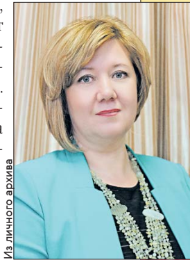
Из личного архива