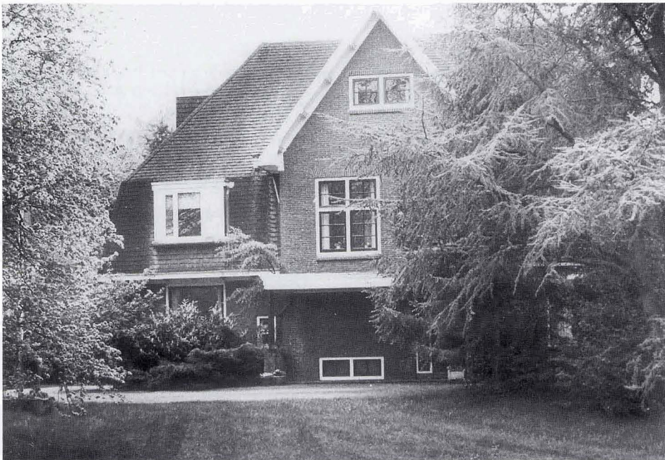
Villa Haimer's Esch aan de Gerinkshoekweg (vroeger Strootsweg), gebouwd door en voor Arend Beltman in 1924, van 1938 tot eind 1942 in gebruik bij de Palestina-pioniers

konden zijn; daardoor verloren o.a. de Palestijnen hun nationaliteit en werden stateloos.