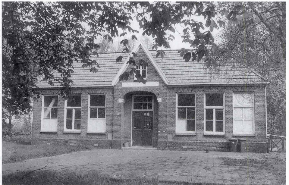
Het Twekkeler schooltje, waar de mannen van de Hachsjarah sliepen, werd door de gemeente Enschede beschikbaar gesteld op verzoek van het Comité Duitse Vluchtelingen

De contacten tussen de joden in de stad en die in Twekkelo werden