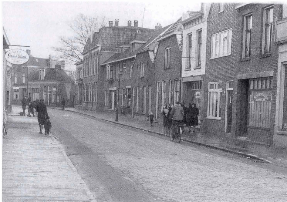
De Alsteedschestraat, ter hoogte van de Mooienhofstraat, in 1940 (situatie thans onherkenbaar: Kuipersdijk!)