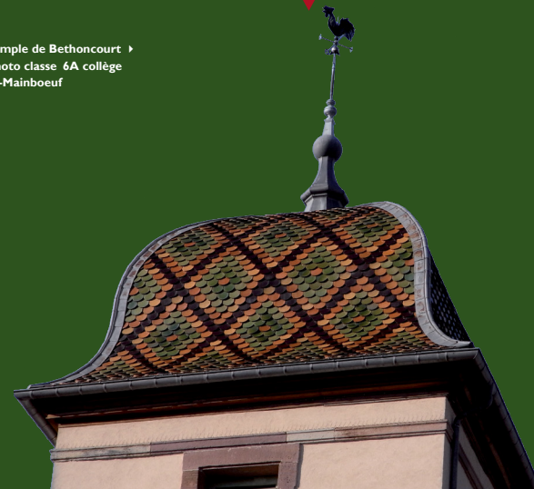
Temple de Bethoncourt

Textes : C. Clerget - Documentaliste Collège Saint-Maimboeuf; MC. Jacquot - Professeur Collège Saint-Maimboeuf; C. Weymuller - service animation du patrimoine; Edition 2009 - Réédition 2012