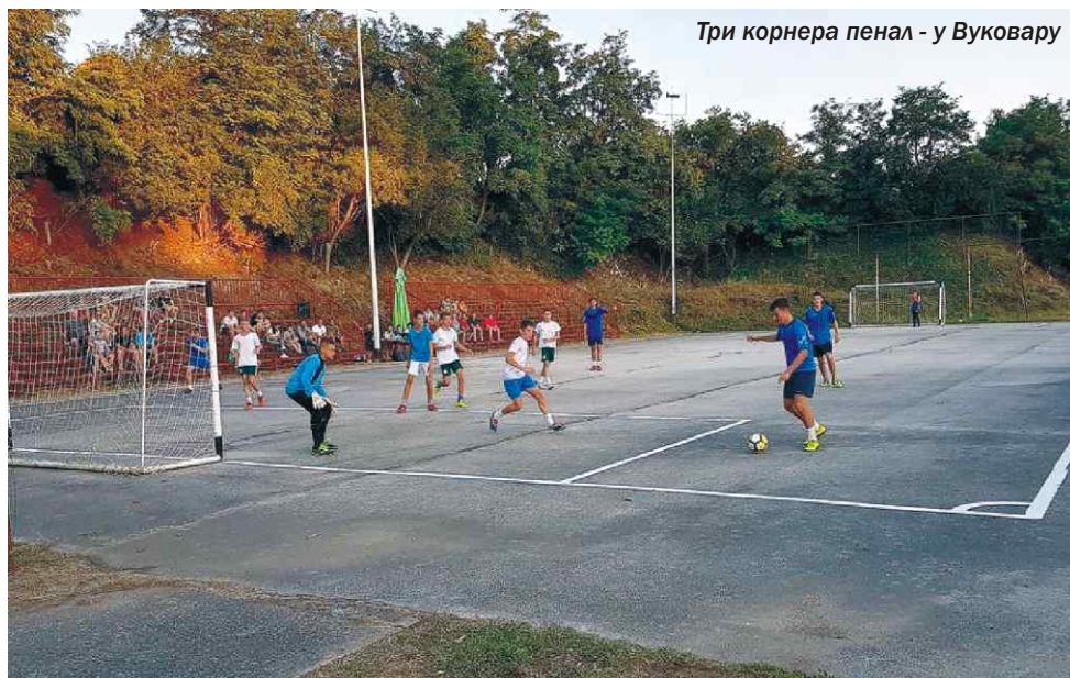
Три корнера пенал - у Вуковару