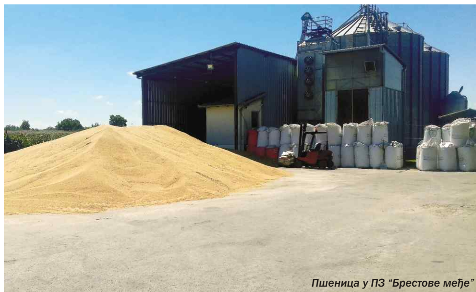
Пшеница у ПЗ „Брестове међе“