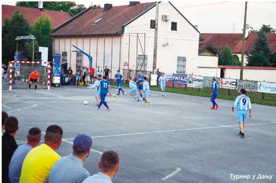
Турнир у Даљу

Иако су пре десетак година готово сва већа места у околини Вуковара имала организоване турнире у малом фудбалу, с временом, што због одласка људи, што због пада интересовања, један по један почео је да се гаси. Данас је ситуација ипак нешто другачија од очекиване, јер упркос тешким условима на овом подручју током летњих месеци имамо десетак турнира, од оних једнодневних до турнира који имају и двадесетак такмичарских дана.