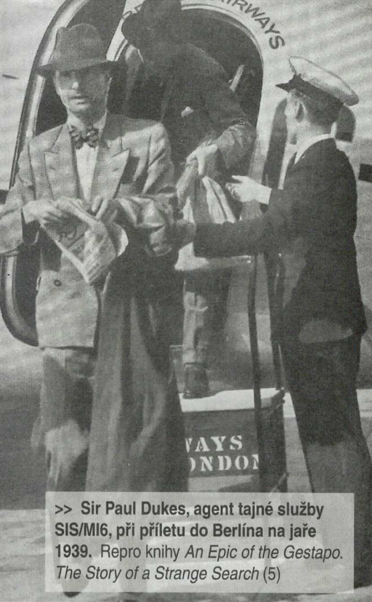
>> Sir Paul Dukes, agent tajné služby SIS/MI6, při přeletu do Berlína na jaře 1939. (5)