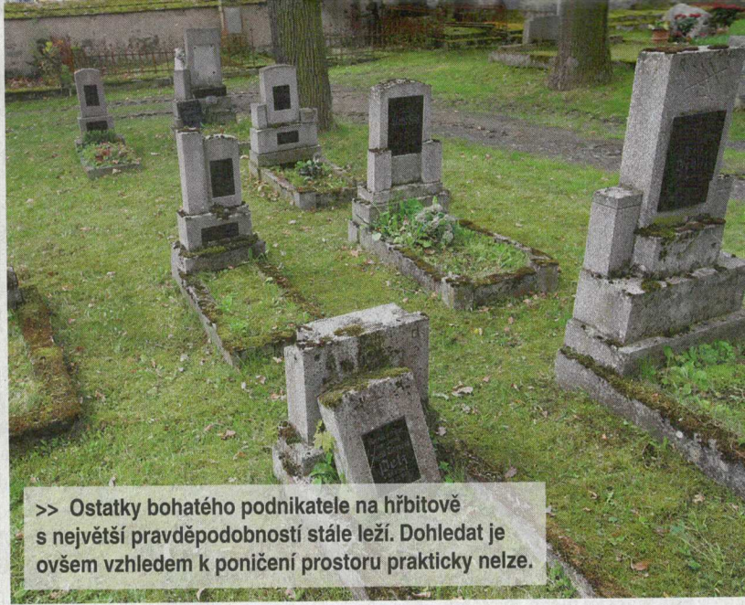
>> Ostatky bohatého podnikatele na hřbitově s největší pravděpodobností stále leží. Dohledat je ovšem vzhledem k poničení prostoru prakticky nelze.

Vydání povolení k jeho cestě do protektorátu totiž proběhlo až nezvykle hladce. Jejím cílem se staly Sudety, konkrétně Stříbro. Město, které se po mnichovské dohodě, na podzim 1938, stalo důležitým bodem, v němž se prověřovaly doklady lidí jedoucích vlakem z Prahy do Norimberku, jižního Německa a Švýcarska. Právě tam gestapo část z nich vyslýchalo.