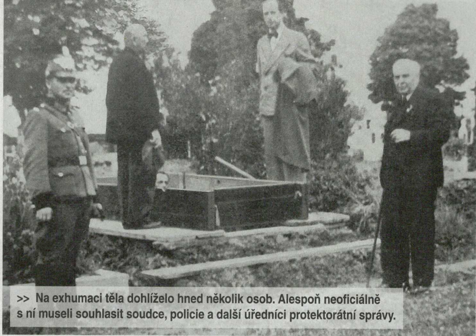
>> Na exhumaci těla dohlíželo hned několik osob. Alespoň neoficiálně s ní museli souhlasit soudce, policie a další úředníci protektorátní správy.