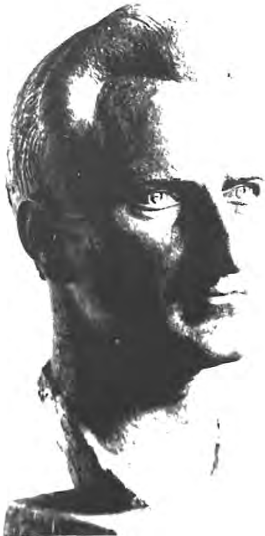
Михайло Черешньовський. Командир УПА ген. Тарас Чупринка (Роман Шухевич).

імперії і шляхом Української Національної Революції та збройних повстань усіх поневолених народів здобудемо Українську Державу та визволимо поневолені Москвою народи» 18 .