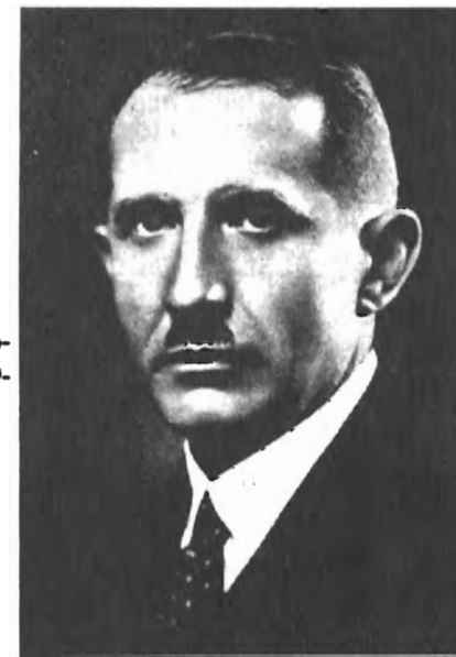
Полк. Євген Коновалець, голова Проводу ОУН, 1929-1938

«Український націоналістичний, революційно-визвольний рух, зформований Організацією Українських Націоналістів, зродився і виріс органічним порядком з двох основних елементів: націоналістичної ідеології і з революційної дії, безкомпромісової збройної боротьби за державну самостійність з боку Української Військової Організації» 1 .