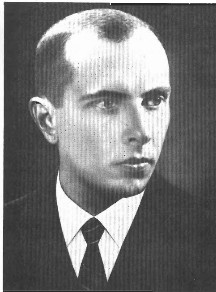
Степан Бандера, красвий провідник ОУН на ЗУЗ, 1933-34, голова РП ОУН, 1940-41, голова Проводу ОУН, 1941, голова Бюра Проводу ОУН, 1945-50, голова Проводу ОУН і ЗЧ ОУН, 1950-59

Закарпатські події причинилися в поважній мірі до рішення групи провідних революціонерів ОУН зформувати в лютому 1940 р. новий провід на місце ПУН, що його назвали «Револьюційним Проводом ОУН» під керівництвом Степана Бандери. «А це тому, що фактично в ОУН до 1940 р. існували два різні, протиставні ідеологічні й політичні потенціали, напрямки, дві протиставні концепції...», — як стверджує Степан Бандера 15 .