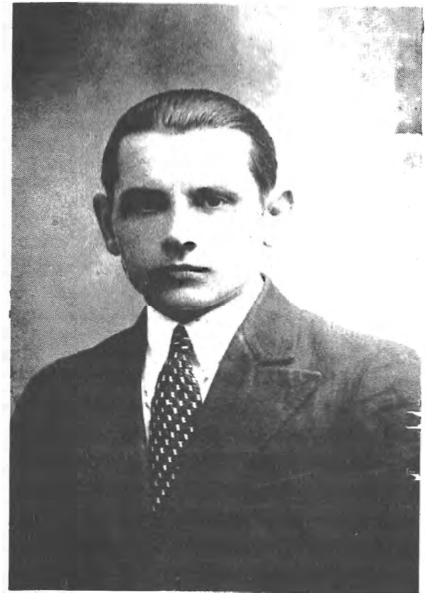
Полк. Олекса Гасин-Лицар, державний секретар в Міністерстві військових справ УДП, 1941, член ГВШ ОУН, 1943-45, член проводу ОУН, 1941-49, шеф Головного Штабу УПА, 1945-49

Проголошення відновлення Української Держави Актом 30 червня 1941 р. у Львові було поєднане з