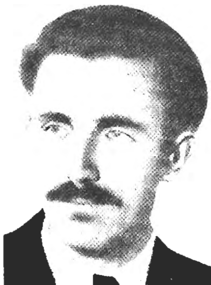
Майор Дмитро Грицай-Перебийніс (генерал УПА, 1945) військовий референт в Проводі ОУН, 1941-45, шеф ГВШ ОУН, 1943, шеф ГВШ УПА, 1944-45

Конференція прийняла концепцію двофронтової війни: «Московсько-большевицькій міжнародній концепції — інтернаціоналу й німецькій концепції т.зв. «Нової Європи» ми протиставляємо міжнародню концепцію справедливої національно-політично-господарської перебудови Європи на засаді вільних національних держав під гаслом — «Свобода народам і людині» 33 .