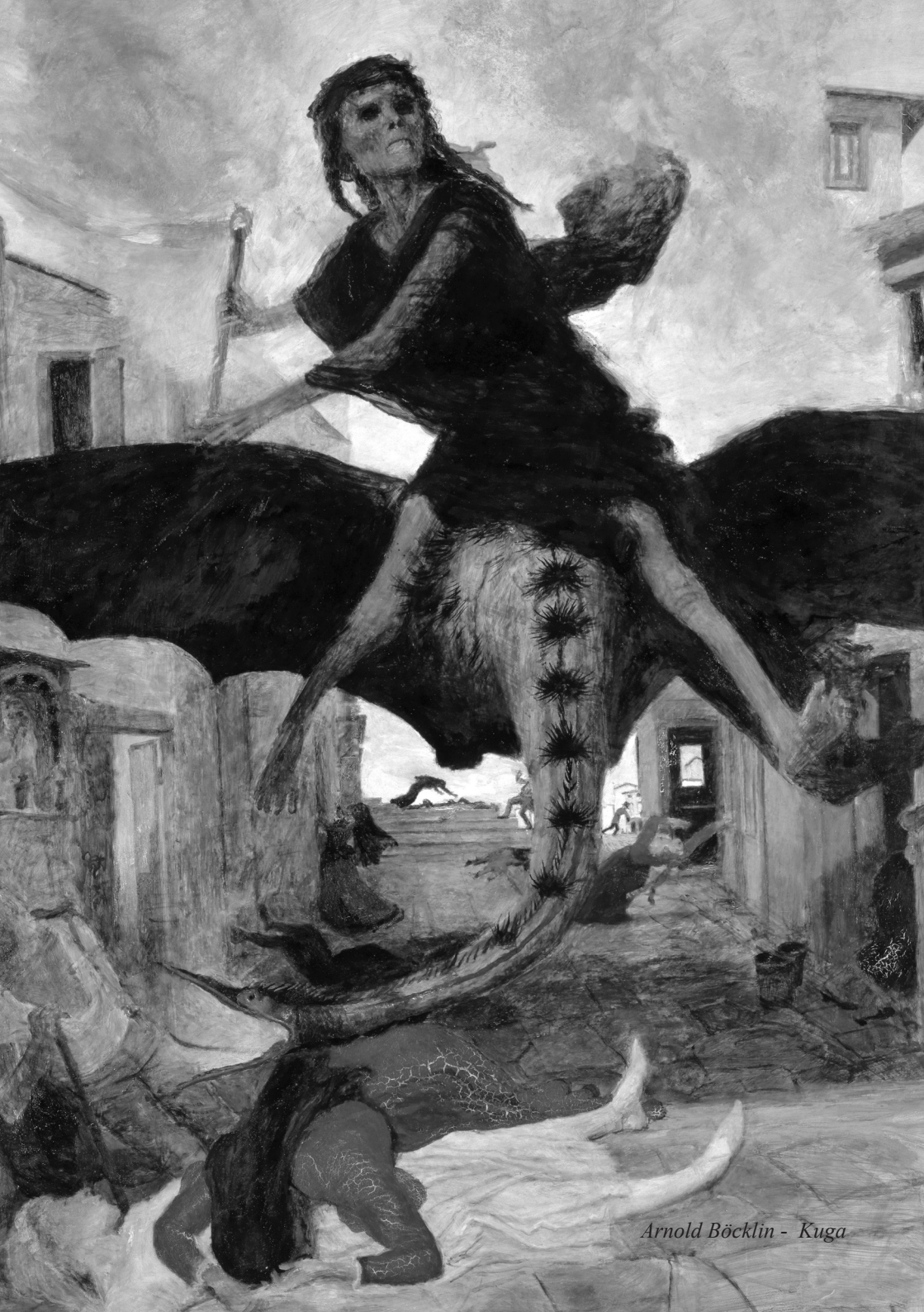
Arnold Böcklin - Kuga