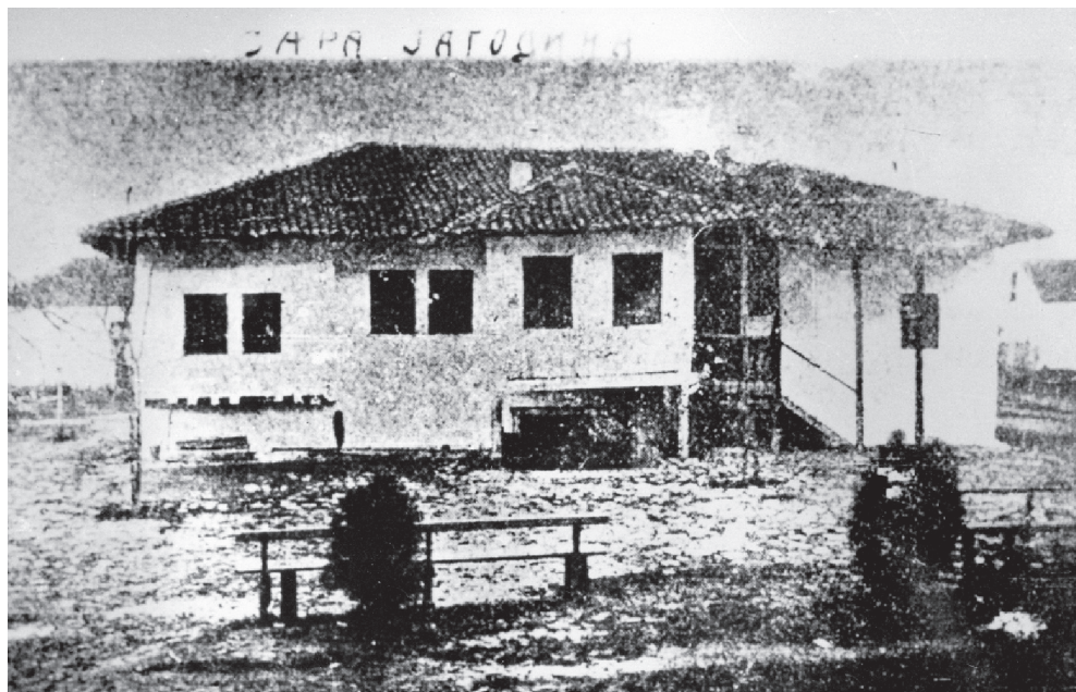
Стара Јагодина: зграда Магистрата, друга половина XIX века