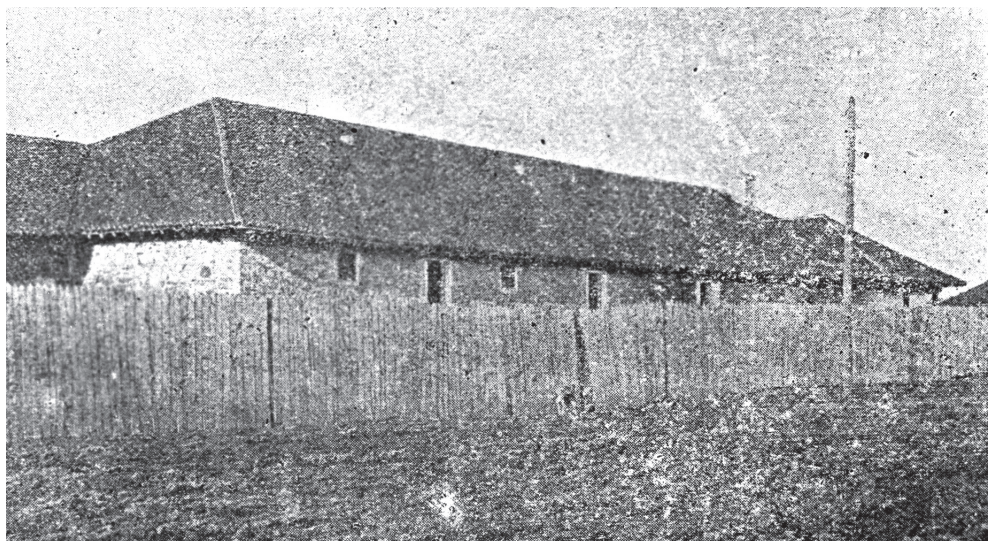
Стара Јагодина: Мезулана