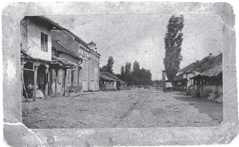
Улица у Јагодини, фотографија Емануела Клара, 1878, Завичајни музеј Јагодина