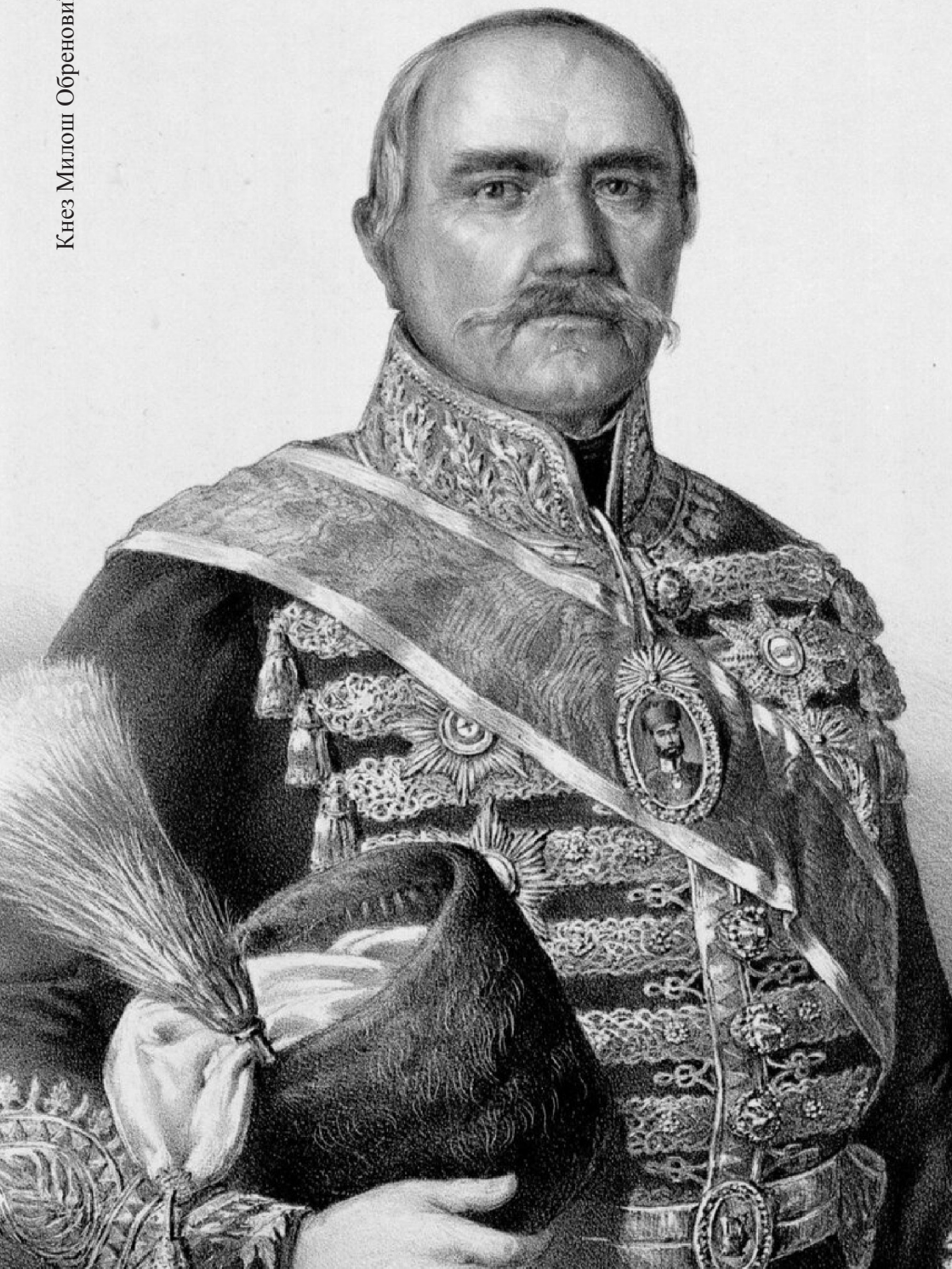
Кнез Милош Обреновић