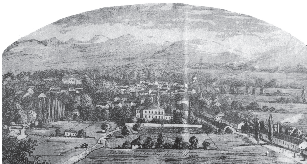
Владислав Тителбах, Панорама Јагодине, 1883, репродукција цртежа, Завичајни музеј Јагодина