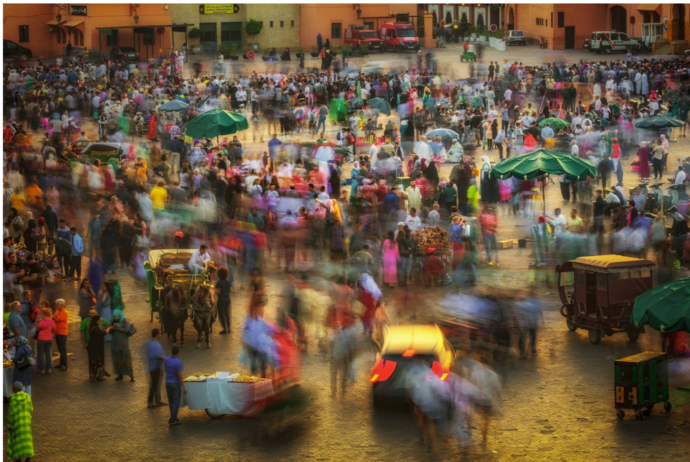
WYRÓŻNIENIE HONOROWE IAAP/IAAP RIBBON Xiping An (China). Heavy traffic