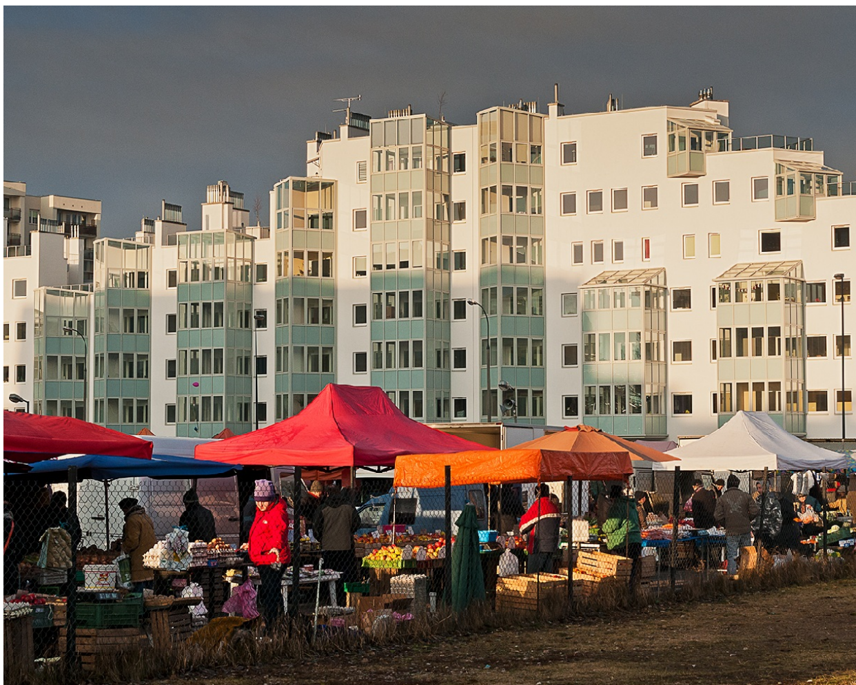
FIAP BLUE RIBBON Piotr Grochala (Poland) Bazar na blokowisku