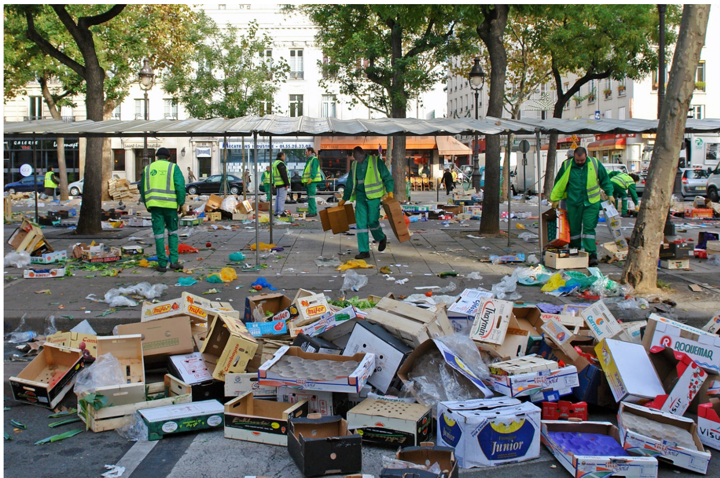
BRAZOWY MEDAL FIAP FIAP BRONZE MEDAL Olle Robin (Sweden) Market day