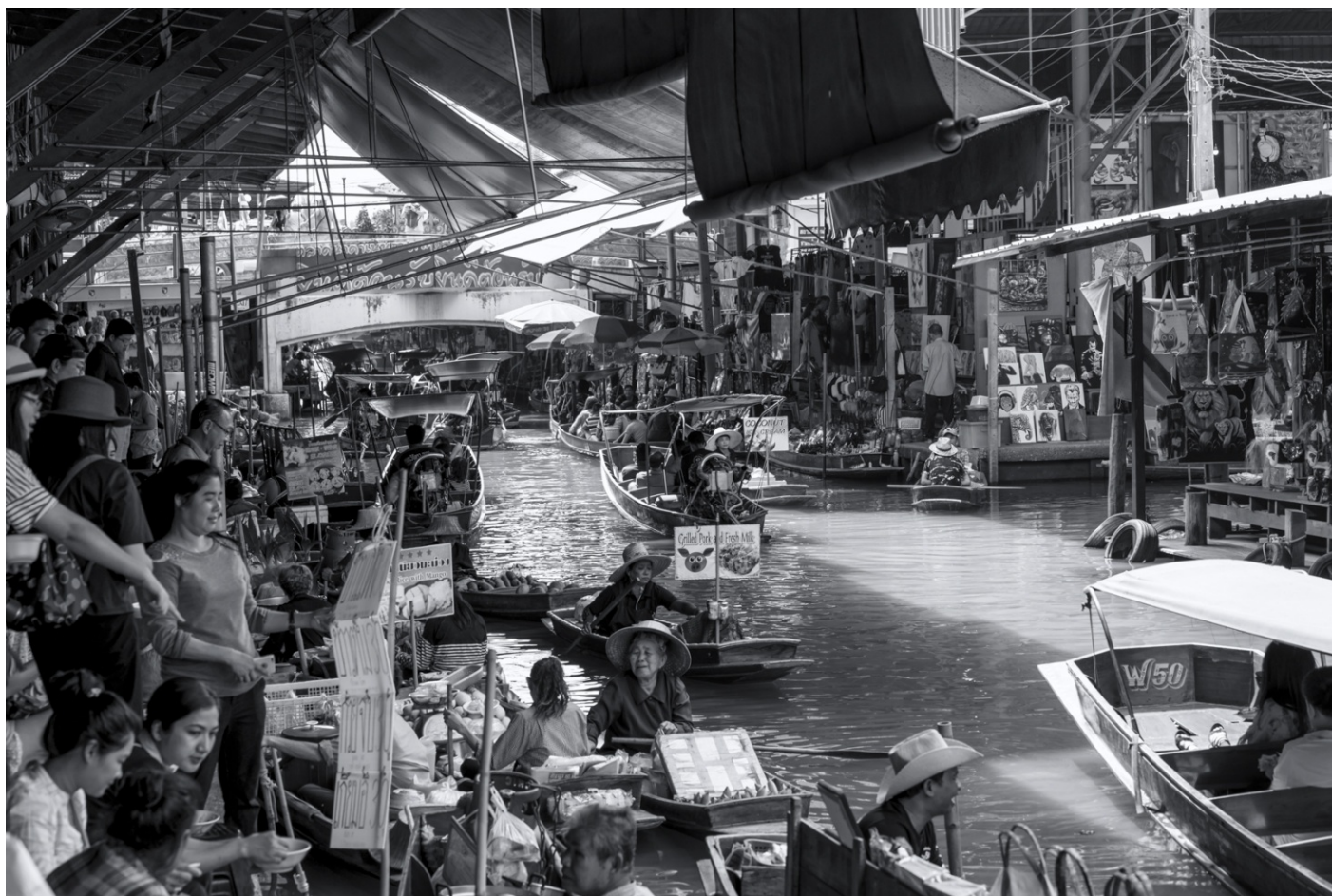
ACCEPTED OPEN SECTION Guido De Muynck (Belgium) Thailand floating market