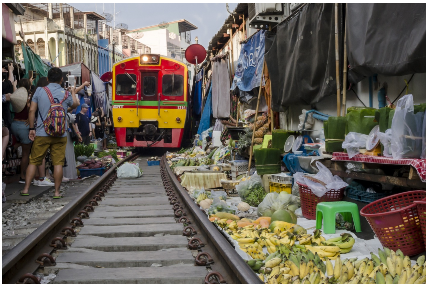
FIAP BLUE RIBBON Guido De Muynck (Belgium) Maeklong Railway market Thailand