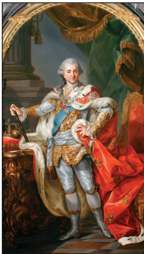
Станислав Август Понятовский

Коронация и коронационный сейм проходили в Варшаве 25 ноября 1764 г., в день Святой Екатерины. В костеле Святого Яна в Варшаве прошло торжественное богослужение и коронация 32-летнего Станислава Понятовского, который по традиции получил второе имя – Август.