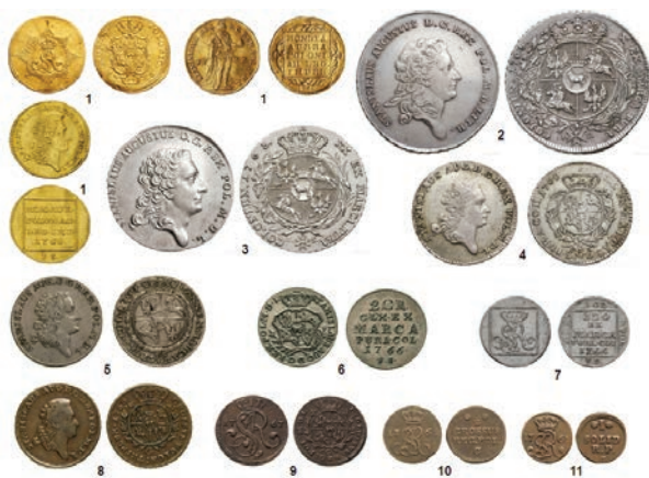
Монеты Речи Посполитой Станислава Августа Понятовского:

Было отвергнуто предложение берлинского банкира Швайгерта (Schweigerta) чеканить 85 злотых из кельнской гривны чистого серебра по монетной стопе, принятой в то время в прусском королевстве. Его поддерживали Гданьск, Торунь и Эльблэнг, указывая, что равная стопа с Пруссией предотвратит вывоз туда хорошей монеты. Но король настоял на чеканке монет улучшенного качества – 80 злотых из одной кельнской гривны чистого серебра, которые с декабря 1765 г. начали чеканить во вновь открытой варшавской минце.