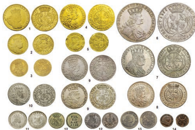
Монеты Августа III, битые в Саксонии для Речи Посполитой:

Насыщение монетного рынка Речи Посполитой новыми монетами было прервано в конце августа 1756 г. оккупацией Саксонии прусскими войсками. Фридрих II (1740–1786) решил насильственно принудить Августа III вступить с ним в союз и действовать в пользу Пруссии. В середине октября того же года 20-тысячная саксонская армия капитулировала при Пирне, и ее солдаты влились в ряды прусских войск.