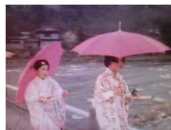
鳥取県での「流しびな」