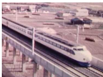
山陽新幹線 新大阪～岡山 開通

“あのとき”を知れば、“当たり前”の今がちょっと違って見えてくるかもしれません。そして、山陰山陽がもっと愛おしくなるかもー。