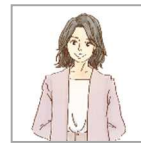
ヤクモ(プロデューサー)