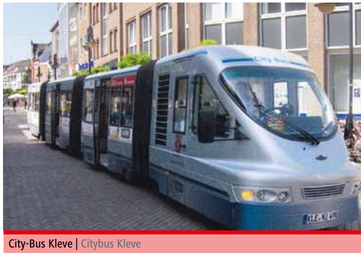
City-Bus Kleve | Citybus Kleve