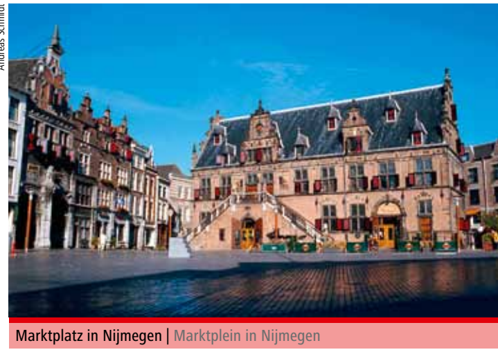
Marktplatz in Nijmegen | Marktplain in Nijmegen