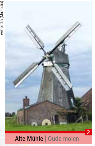
Alte Mühle | Oude molen