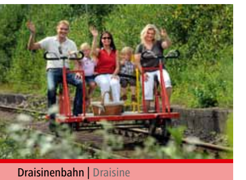
Draisinenbahn | Draisine