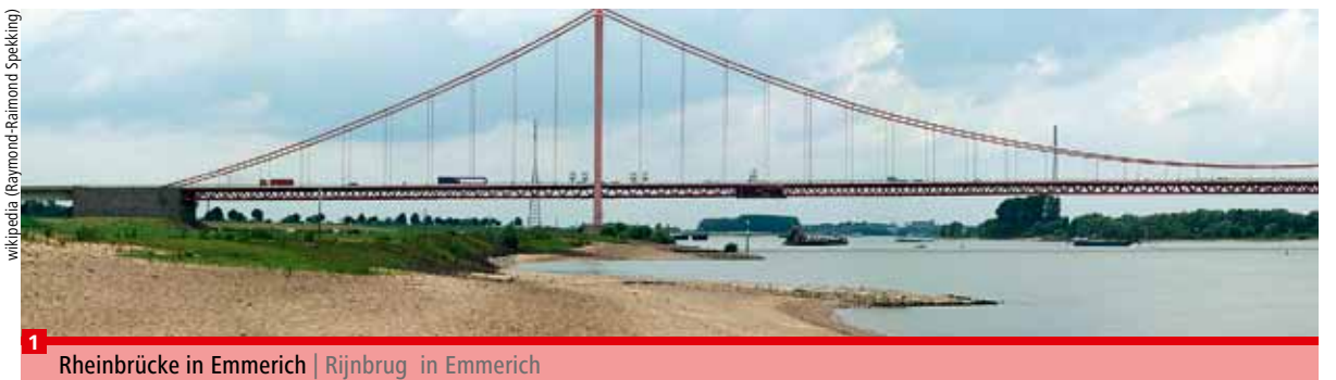
Rheinbrücke in Emmerich | Rijnbrug in Emmerich

Die Hochschule Rhein-Waal am Standort Briener Straße ist mit den Linien 50, 52, 57 und K-SB 58 erreichbar. U bereikt de Hogeschool Rhein-Waal in Briener Staat met de lijnen 50, 52, 57 en K-SB 58.