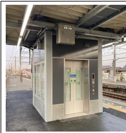
【エレベーター外観】