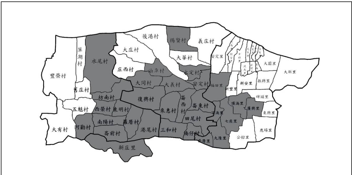
圖 2 崙背、二崙、西螺詔安客家聚落周邊範圍分佈圖