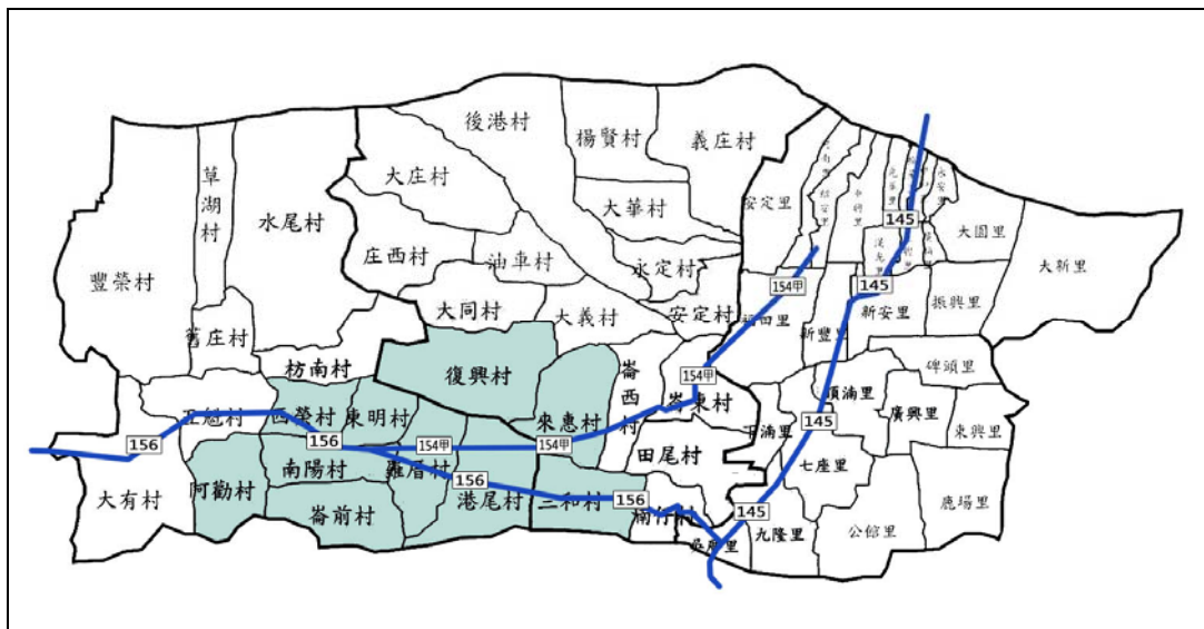
圖 3 崙背、二崙、西螺詔安客語使用情形較佳之村里分佈圖

本計畫調查出目前使用詔安客語情況較佳的區域則是沿著縣道 156 與縣道 154 甲線分布。目前主要使用詔安客語的聚落北界為二崙鄉復興村龍結路與復興路；南界在新虎尾溪，在崙背鄉、二崙鄉內，新虎尾溪以北之地區皆有使用詔安客語的情形；東至二崙鄉的田尾、浦仔村以台糖五分車路為界；西至崙背鄉阿勸村的鹽園聚落。此範圍比對應吳中杰老師在《台灣客家語言與移民源流關係研究》之結果已經有縮減的趨勢。在短短 1 年半期間已經快速縮減。從年齡層分布來看，18~34 歲年齡層客語能力的喪失會產生嚴重地客語傳承斷層。無論從空間分佈與年齡層分布來看，在在顯示詔安客語使用已經出現嚴重的傳承危機。(圖 3)