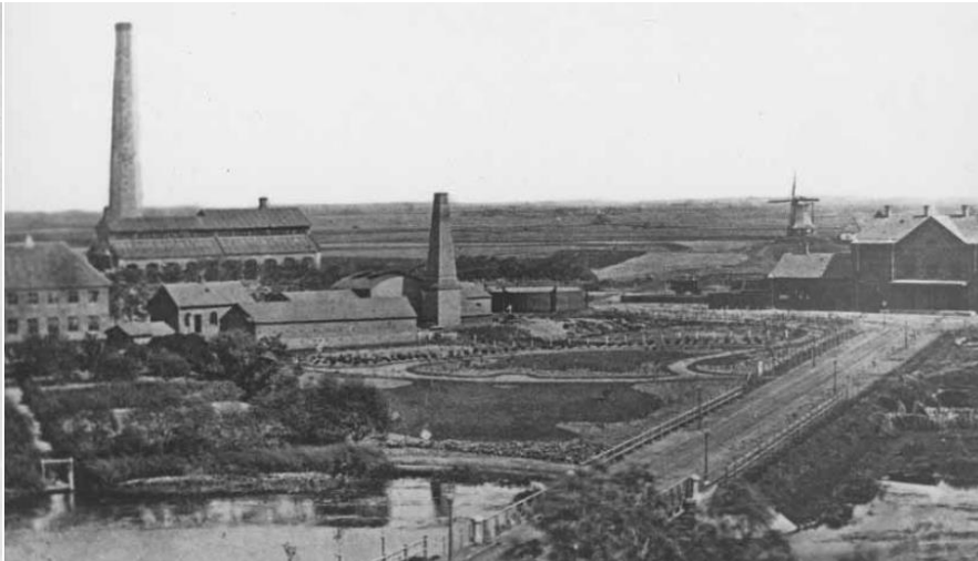
Til venstre ses den nye afdeling af Giørtz' Bomuldsvæveri i Sct. Nicolajgade. Den blev opført 1866 og nedlagt i 1925. Bomuldsvæveriet er bygningen med den højeste skorsten. Den anden bygning med skorsten er gasværket.

Købmand, skibsreder, rådmand og fabrikant